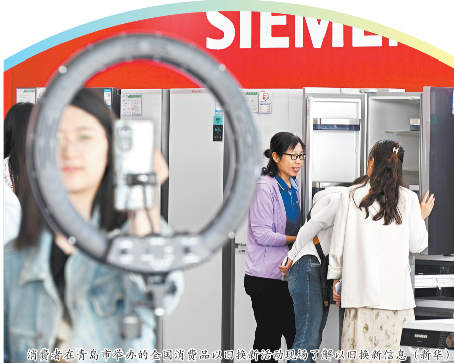
消费者在青岛市举办的全国消费品以旧换新活动现场了解以旧换新信息。(新华社)

国家税务总局税收科学研究所所长黄立新表示,增值税发票数据反映“两新”发展势头良好,生产需求稳中有升,市场信心正在增强。随着“两新”政策覆盖面不断扩大、近期一揽子增量政策持续落地,政策效用有望进一步得到释放,继续促进产业升级,增进民生福祉,推动经济高质量发展稳步向前迈进。(中新)