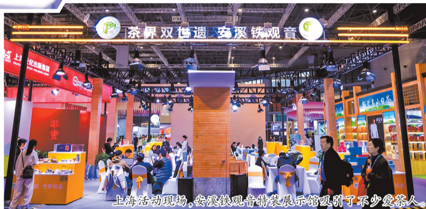
上海活动现场,安溪铁观音特展展示馆吸引了不少爱茶人