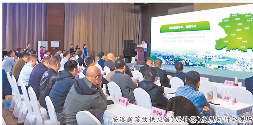
安溪新茶饮供应链(原料茶)发展研讨会现场