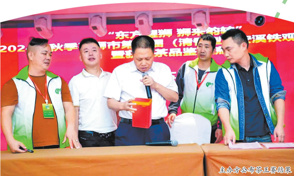
主办方公布茶王赛结果