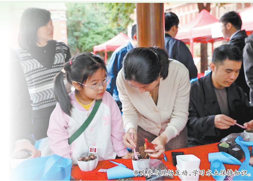
市民参与现场互动,学习水土保持知识。

12月以来,市水利局组织各县(市、区)以福建省第十一个水土保持宣传日为契机,广泛开展形式多样的水土保持宣传活动。据不完全统计,全市累计开展水土保持宣传11场次,参加人数2.19万人;发放水土保持宣传册4.6万份、水土保持宣传用品3.85万份;向群众发送宣传短信127.8万条,开展水土保持知识有奖问答活动,参与群众1.74万人次;在市区重要路口LED屏、公交车宣传屏上投放水保宣传标语,覆盖群众100多万人次;微信视频号、朋友圈宣传覆盖5.8万人次。