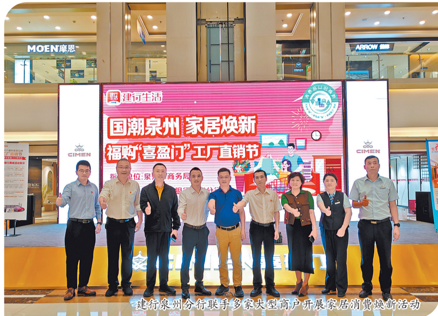
建行泉州分行联手多家大型商户开展家居消费焕新活动

“天天好券”等主题活动,“建行生活”用户每天可在“好券中心”领取会员充值、电影、美食等限时好券,在购物、餐饮、娱乐等方面节省开支,让消费者“省钱有方”。活动开展以来,带动消费笔数8万多笔。