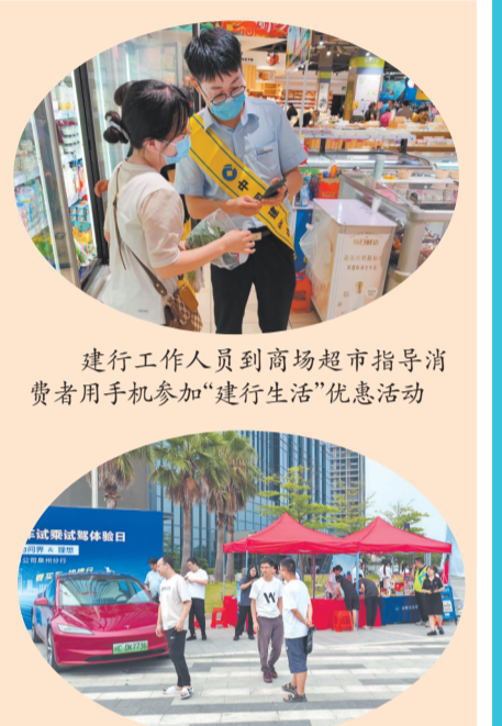
建行工作人员到商场超市指导消费者用手机参加“建行生活”优惠活动