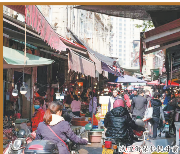
城隍街保护提升前

融媒体记者 黄耿煌 胡彦明 通讯员 林育超 余清威 文/图(部分图片由八卦街保护提升工程指挥部提供)