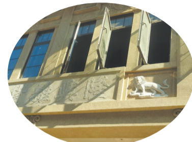
以“修旧如旧”原则堆灰塑 恢复建筑风貌

2023年,以八卦街保护提升工程为核心的石狮市老城中心区城市更新,成为省级县域更新建设样板。