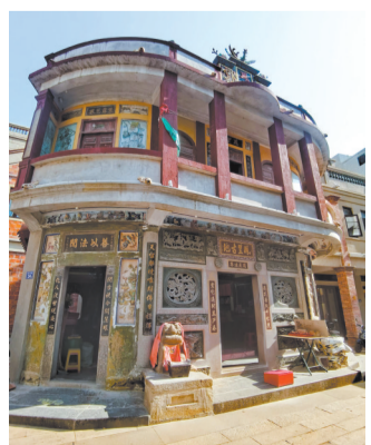
古时一句“去石狮吗”便立下约定,也让这座城市因诚实守信而有了名字——石狮。

八卦街街区不仅是商贸中心,也像是一个宗教博物馆,建筑大观园,遍布石狮起源与兴盛的古迹。在清代,八卦街街区的宽度通常只有3米左右。1927至1933年,石狮华侨倡导投资拓建,新建街道,至1949年前夕,石狮已初具商业街市规模。随着街道的拓宽,原沿街建筑拆除后建设了骑楼,西式材料与本土材料相结合,立面装饰大多有很强的南洋风格。华侨们还在街区集资或捐资兴建了迎南园、爱群小学、聚仁楼等,见证其宽厚仁德、热衷公益之心和满满的爱国情怀。