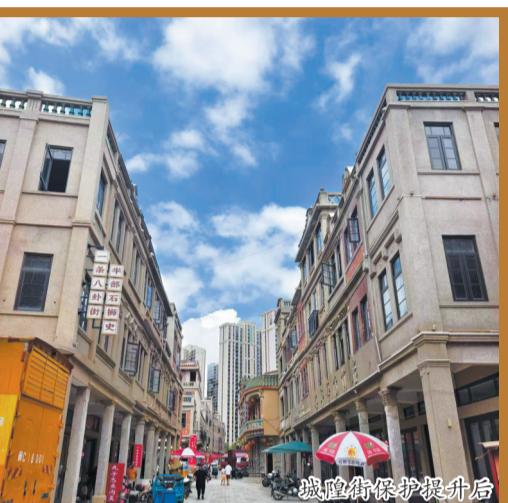
城隍街保护提升后