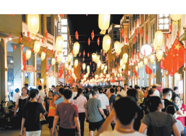
经过改造提升,八卦街日渐成为石狮新的文旅目的地。

未来的八卦街,既是城市的根,作为古早商贸市集传承地,传承并延续街区历史文化价值与特色,也是城市品牌,作为城市文化休闲会客厅成为石狮城市对外展示的窗口。