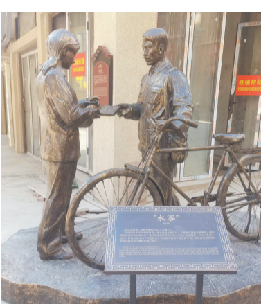
改造提升后,八卦街片区围绕发展历史文化创作展出独具特色的街头雕塑小品。