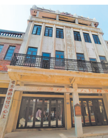
见证石狮商贸繁荣的洪德泰环球百货商场,是石狮人勇闯商海的缩影。