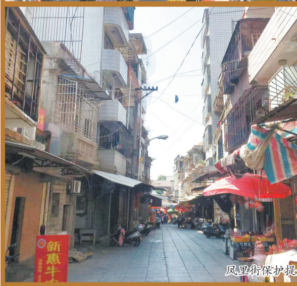
凤里街保护提升前