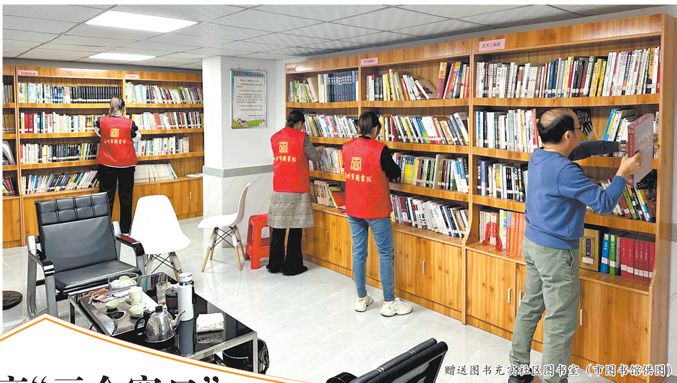
赠送图书充实社区图书室(市图书馆供图)

今后,市图书馆将进一步推进社区文化“嵌入式”阅读服务,开展读书会、讲座、展览等活动,不断丰富社区图书室图书数量、种类,确保书籍及时更新,千方百计为社区群众提供“可听、可看、可学、可互动”的智慧文旅服务。