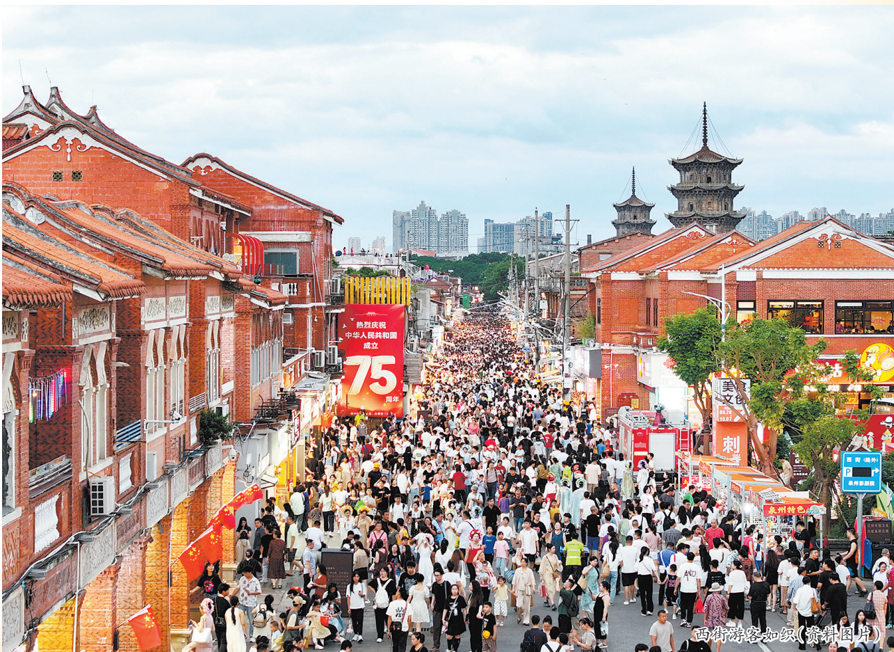
西街游客如织(资料图片)

西街是泉州最早开发的街道和区域,早在宋朝,它就已经象征了泉州的繁荣,它还是泉州市区保存最完整的古街区,保留着大量具有历史原貌的建筑。这条古街区犹如一串耀眼的珍珠链,将泉州唐宋以来众多绚丽多彩的文物胜迹和古街古民居以及附于其间的名贤逸事、民间传说一贯穿起来。除了开元寺、东西塔、城心塔,名人宅第、近现代洋楼外,还保留着大量风姿独特的古大厝,古色古香的木楼群,是一个活的建筑博物馆,既蕴含着古城丰厚的历史文化积淀,又诉说着古城革故鼎新的百年沧桑巨变。