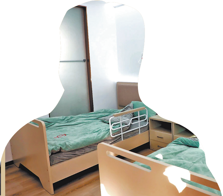
床铺也能进行适老化改造

客户需求设计的车内扶手和安全带,能够确保老年人乘车安全;车内配备了装有速效救心丸、藿香正气水、医用纱布、创可贴等应急物品的急救箱。今年,泉州又推出37路车(中国闽台缘博物馆⇌中远学校)、K603路车(文化宫⇌福厦高铁泉州南站)等2条适老化公交线路,并投入25辆适老化公交车,让老年人出行更方便、安心。