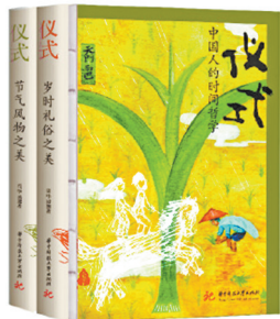
周华诚 著 华中科技大学出版社

记忆中的“岁时广记”,文字里的“故乡时间”。此书讲述藏在中国二十四节气和传统节日里的生活美学,既是对中华优秀传统文化和生活之美的追寻,又是对当下社会发展的珍贵记录。作者文字风格活泼灵动,注重当下体验。吃茶且看花,日长如小年。光阴短长,皆在字里行间。文字空灵温暖,令人感动。