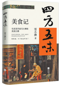
《四方五味》 雪小禅 著 江苏凤凰文艺出版社

阳的肠旺面、丽江的铜锅饭……食物与世间风物紧密相连,构成了一道道诱人的旧时味道。 人间烟火,最抚人心。这本书,是记忆中悠远绵长的美食滋味。我们不仅能够品尝到四方美食的魅力,更能够感悟到人生的五味。千山万水走过,仍是旧时模样。现在读起来,不仅舌尖上有回忆,心里更有那些绵密的友情、深情。说到底,菜,还是连着人心才更有味道:走到哪里都是故乡,走到哪里都有故人。