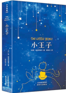
《小王子》 圣埃克苏佩里 著 天津出版传媒集团

作者突破常规童话写作思路,采用回忆式的写法,向我们讲述这个诗情画意的童话故事。小说一开始写作者在撒哈拉沙漠发生飞机故障,正在修理发动机,被突然造访的小王子打断,从而认识了小王子。接着,作者通过聊天了解到小王子身上的传奇故事:小王子居住的星球上有火山、猴面包树以及玫瑰花。小王子本该享受所拥有的幸福,却因受不了玫瑰花的矫情选择了逃离。在之后的旅程中,他遇到自吹自擂的国王、忧郁的酒鬼、忠于职守的点灯人、足不出户的地理学家。最后小王子去了地球,在沙漠与小蛇相遇,遇到狐狸……小王子在途中越来越孤独,越来越想念他的玫瑰花,在一年后他终于回到了自己的星球。 书中处处蕴含着人生大智慧,有很多经典语录,比如:“如果你和别人产生羁绊,就要承受流泪的风险。”“可是,可是我那时太年轻,不懂怎样去爱她。”像这样有关爱与责任的语录比比皆是。可单看这样的句子,我们并不能产生深刻的理解。小说用小王子的故事诠释了这些道理。一开始,小王子因为和玫瑰花产生了误解,离开了玫瑰花,他固执己见,以为自己的离开是对的,直到他遇见了狐狸。狐狸告诉小王子:“你培植的,驯服过的一切,现在你都要负责到底。”小王子才恍然大悟:真正的东西是眼睛看不到的,要用心去发现。小王子星球的玫瑰花虽然很普通,但是因为他经常给玫瑰花浇水驱虫,他已经把玫瑰花驯服了,人要对自己驯服过的负责。“我要对我的玫瑰花负责。”当小王子说出这句话时,他已经后悔莫及。 读着读着,我们仿佛在小王子身上找到了自己的影子,对过往的一切,内心也会涌起无尽的悔恨和自责,却无力去改变了。小王子站在一个孩子的视角,他能懂得很多我们大人终其一生看不透的道理,我们却深陷生活的泥沼,看不到事情的真相!无论你在什么年纪,希望你翻开这本书的时候,能静下心来好好品读,好好感悟! 小王子,是我们每个人心中永远的梦!