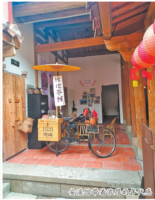
安溪馆带着浓厚的年代感