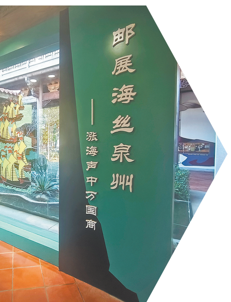
泉州通远阁海丝邮局·非遗传承中心以邮展形式讲述泉州“海丝”历史文化

泉州古城的住宿选择多样,从泉州酒店这样的老牌星级酒店到旧馆驿、西街行舍等特色民宿,都带给游客难忘的旅游体验。对于寻求更深入地了解泉州文化的游客来说,古城内的特色民宿具有很大的吸引力。一些民宿不仅靠近知名景点,地理位置优越,还特别设了高层观景天台,让游客在欣赏古城全貌的同时,还能沉浸式体验闽南古厝的韵味和老街巷的热闹。民宿内部的咖啡厅、茶室和花园也为游客提供了一个文艺氛围浓厚的休憩空间。此外,古城内如今也有不少特色精品酒店,像由原钟楼百货改建的七树钟楼,就以其地理位置、历史性和设计感等受到欢迎。