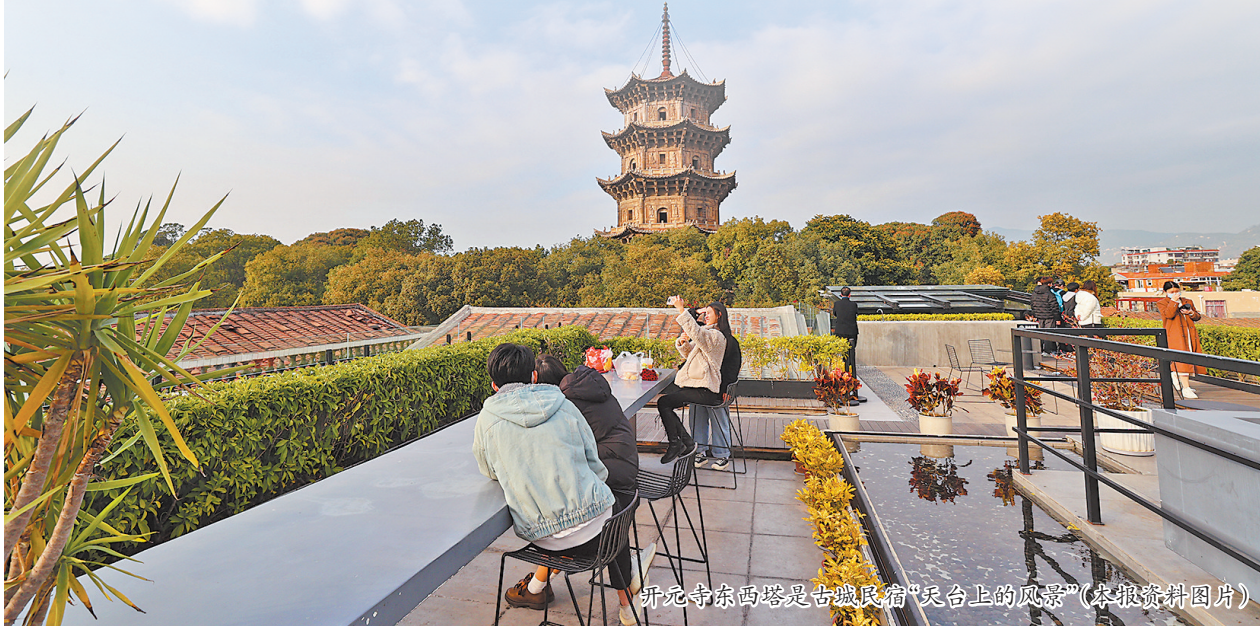
开元寺东塔是古城“天台上的风景”