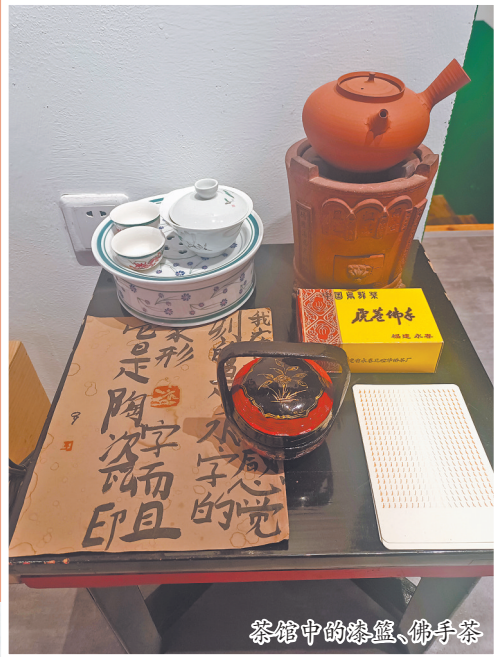
茶馆中的漆器、佛手茶