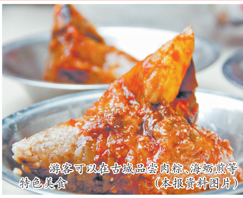
游客可以在古城品尝肉粽、海蛎煎等特色美食(本报资料图片)