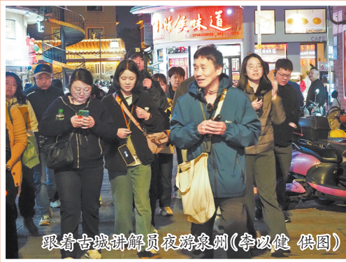
跟着古城讲解员夜游泉州(李以健 供图)