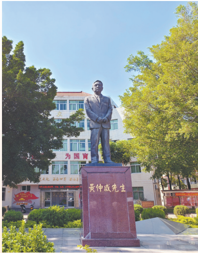
南安诗山中学内的黄仲咸先生塑像

1921年,黄仲咸出生在南安码头镇仙都村一户农家。1935年,随长兄南渡,赴印尼东部绍岛谋生。在岛上,他一路打拼,在多个行业均有建树,最终拥有亿万巨资,缔造了当时印尼商界的传奇。20世纪50年代,目睹中华人民共和国成立后祖国的巨变,也看到了家乡落后的面貌,黄仲咸暗下决心,要用实际行动帮助家乡崛起。1959年,他慷慨解囊捐资助建家乡的仙都小学,从那一刻开始,正式开启了他近半个世纪的公益慈善事业。20世纪70年代至80年代末,黄仲咸在南安捐建了中小学、幼儿园、医院楼宇等20多个项目。1990年,黄仲咸慨然捐资2000余万元,独资创建了“南安市黄仲咸教育基金会”,开始将慈善事业由“业余活动”变成“正式职业”。在继续为家乡学校、医院捐建楼宇等硬件设施、设备的同时,黄仲咸又设立了奖教助学金,大力支持家乡教育事业的发展。几十年来,受益的师生数不胜数。2004年,他将基金会升格为“福建省黄仲咸教育基金会”,把公益慈善活动范围扩大至全省老区、山区。黄仲咸把自己辛苦赚来的数亿家财,化作绵绵爱心,洒向万千学子。而他每年也会收到全省各地受助学生写来的感谢信,每个信封收信人一栏都整齐地写着——“亲爱的黄爷爷”。几十年来,这样的信函累计达上万封之多,这些信函也成了黄仲咸晚年津津乐道的一生“最大财富”。