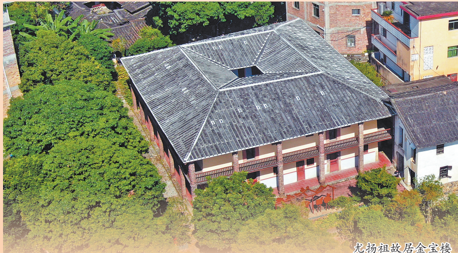
尤扬祖故居金宝楼