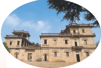
梧林传统村落内独特洋楼朝东楼

晋江龙湖镇梧林村被誉为“侨乡中的侨乡”,村内众多番客楼,造型各异、错落有致。在这些番客楼中,春晖楼尤为雄伟壮观。它的建设者,是曾为抗日战争作出巨大贡献的爱国华侨、菲律宾中华总商会会长许友超。许友超早期在菲律宾经营木厂,1930年前后,他已是菲律宾最古老华侨社团“中华木商会”会长,同时也是东方共济俱乐部总理、中华青年会董事。1932年,年仅32岁的许友超当选菲律宾中华总商会会长。1931年,“九一八事变”发生后,许友超积极响应国内抗战呼声,与爱国华侨李清泉等有识之士一道组织成立了“菲律宾华侨援助抗战委员会”支援祖国抗战。这是抗战爆发后,东南亚最早出现的华侨抗日救国团体。1932年,李清泉、许友超等人组建了“中国航空建设协会马尼拉分会”。随后的数月内,他们在菲律宾各地组织了35个航空建设分会,筹款达300万元,一共购买了15架飞机,并设法将这批飞机送到国内抗战部队的手上。1945年,日本宣告投降。许友超组织华商社团回到马尼拉,慰问和帮助当地菲律宾人民重整家园。1946年,他独力出资,在梧林村中为母亲建造一座高大的、坚固的、可以挡风避雨的闽南洋楼建筑。历经两年时间,这座楼方才建成。许友超将这栋楼命名为春晖楼,取“谁言寸草心,报得三春晖”之意,借以报答母亲含辛茹苦的养育之恩,弥补长期未能承欢膝下之痛。同时,也寄托自己对梧林故园的浓浓乡愁。