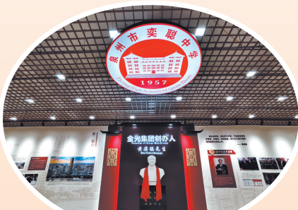
奕聪中学内的黄奕聪先生事迹展厅