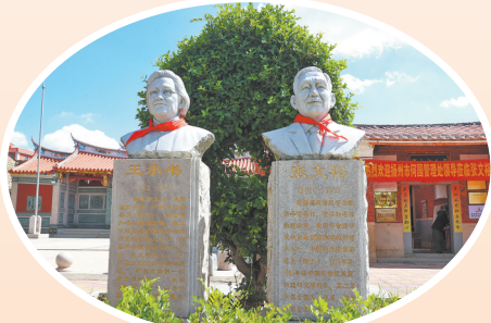
张文裕夫妻的半身塑像立于其故居前的广场上

科学家张文裕的故居位于现惠安涂寨镇新亭村官后自然村,这里曾是张文裕、王承书夫妻俩生活过的地方,每年都会有很多人来到这里瞻仰这对科学界的“神仙眷侣”。张文裕、王承书夫妻俩是世界科技领域的佼佼者,都曾留学美国。在祖国最需要他们的时候,夫妻俩又一同毅然回归中国。归国后,张文裕曾在西南联合大学任教,开设了“天然放射性和原子核物理”的课程,对象主要是助教和研究生,其中包括杨振宁、唐敖庆、虞福春、梅镇岳等精英人才。后来,张文裕、王承书被安排在中国科学院近代物理研究所工作。张文裕任宇宙射线研究室主任、研究员,1957年被选聘为中国科学院学部委员(后称院士)。王承书是我国铀同位素分离理论研究的奠基人,还为我国第一颗原子弹的成功爆炸及铀浓缩技术的发展作出重要贡献,于1980年当选中国科学院学部委员。“夫妻院士”成为国内科学界的一段美谈。近年来,张文裕故居被授予惠安县“爱国主义教育基地”和“国防教育基地”等称号。而在故居外的广场上,立有这对夫妻院士的半身塑像,他们和蔼亲切的面容,感染着四面八方慕名而来的参观者。