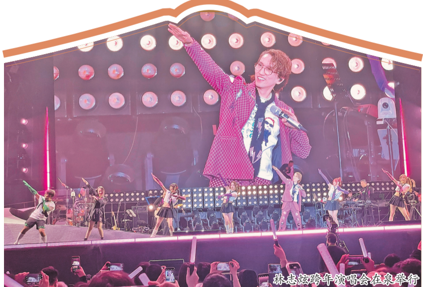
林志炫跨年演唱会在泉举行