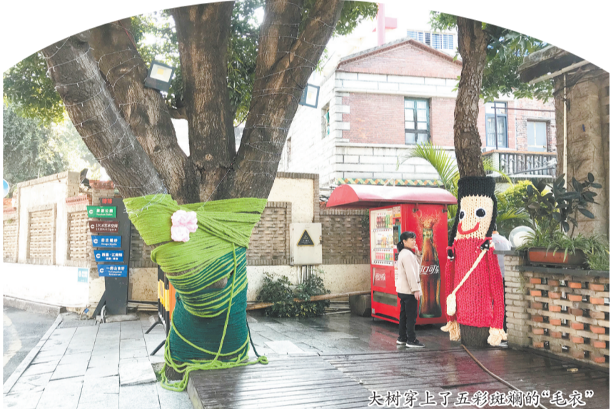
大树穿上了五彩斑斓的“毛衣”

孩子们编织的“毛衣”色彩丰富,样式可爱,创意十足,为大树赋予了“生命”和“活力”,有些大树或背着斜挎包微笑,或睁大眼睛欢迎着往来的人,成为园区里一道独特又温馨的风景区。“希望通过此次活动,进一步美化环境,让更多人关注绿化树,增强大家的环保意识。”鲤城生态环境局工作人员表示。