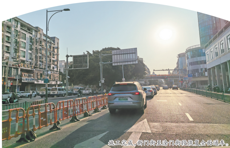
施工完成,新门街至涂门街段恢复全面通车。

据介绍,此次施工采用明挖与顶管相结合的方式。其中,涂门街(新华路以西段)采用明挖方式施工,新门街—涂门街