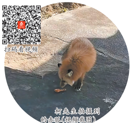
柯先生拍摄到的赤狐(视频截图)

“此前有游客向我们反映看到了狐狸,根据市民拍摄的视频可以确认是赤狐。”晋江市林业和园林绿化局野生动物管理站工作人员介绍,泉州范围内没有野生的赤狐,有的人会将赤狐当作宠物饲养,但由于缺乏饲养经验或是味道难以忍耐等原因最终弃养或者放生。该工作人员表示,赤狐不会