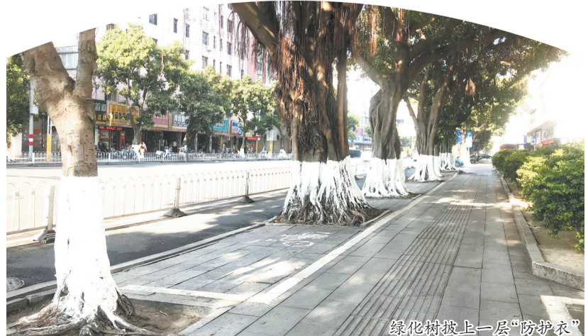
绿化树披上一层“防护衣”

该负责人说,每年冬季,他们都会给绿化树涂白,涂白剂的主要成分就是生石灰。此外,涂白能降低树木温度,能延迟树木萌芽、开花时间,可以避免春季晚霜冻害,涂白能减少树木的水分蒸发,一定程度上可预防抽条。