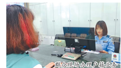
群众现场办理户籍业务

本报讯(融媒体记者张文璟 通讯员何玮植 张希达 文/图)日前,惠安县公安局通过不断深化公安政务服务改革,切实为群众办实事、解难题,组织推出便民服务举措,开通户籍窗口线上预约服务。