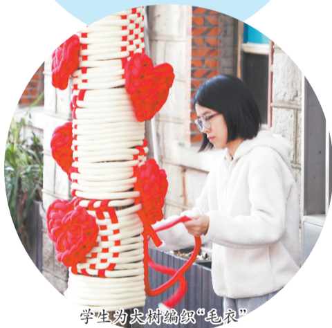
学生为大树编织“毛衣”