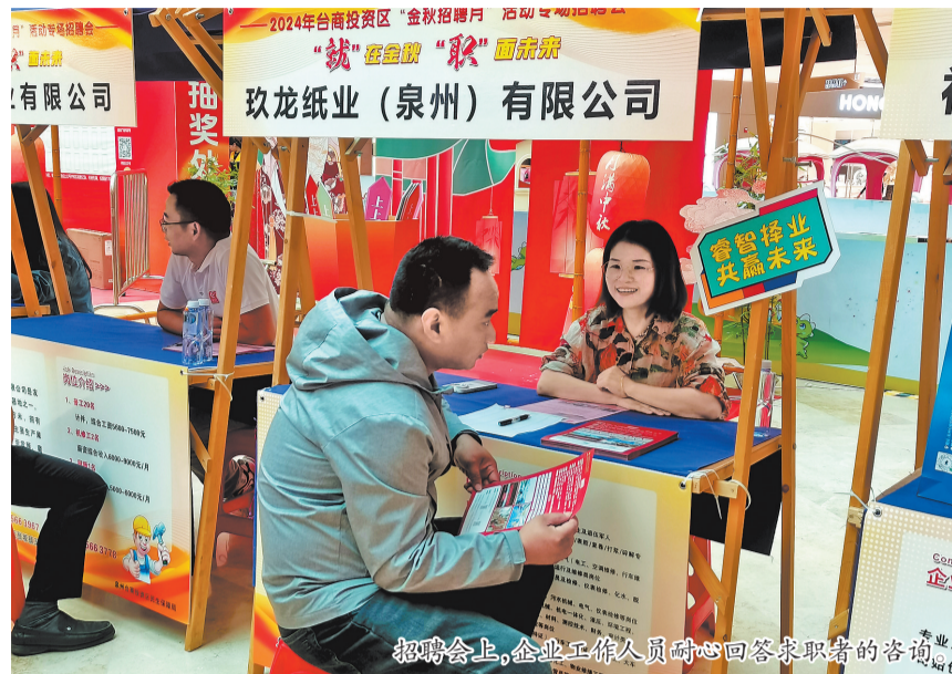
招聘会上,企业工作人员耐心回答求职者的咨询。

台商区去年共开展技能培训1933人次,超额完成全年任务的120.81%。新批准设立了2所技工学校,台商区成功获批市级高技能人才培训基地。截至去年12月底,新增取得高级工以上职业资格证书或职业技能等级证书的人数达到752人,是全年任务的250.66%,技能人才队伍建设取得显著成效。