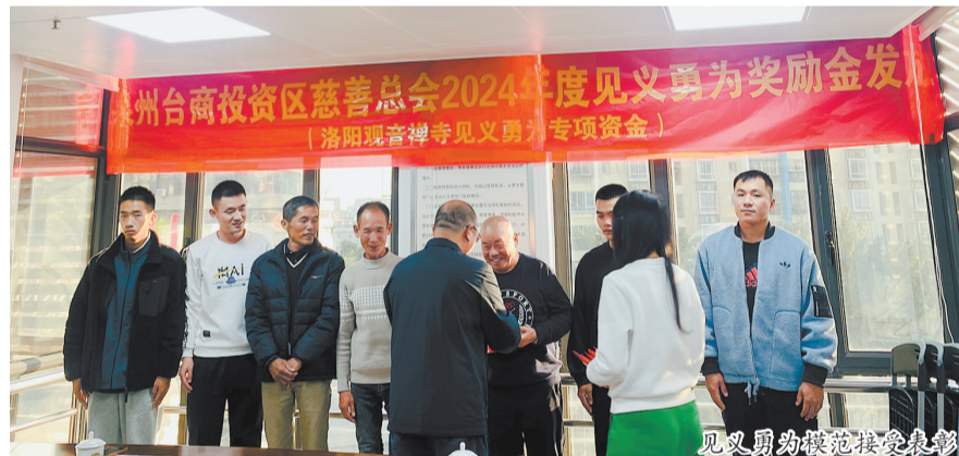
见义勇为模范接受表彰。

据了解,自2021年起,洛阳观音禅寺释开印法师在泉州台商投资区慈善总会设立了见义勇为专项奖励资金,每年捐赠10万元,用于奖励见义勇为英雄和救助受伤人员。此次活动为该专项资金的第3次颁发,奖励对象包括户籍在台商区或在台商区生活、工作且其见义勇为行为受到相关单位认定、表彰的人员。