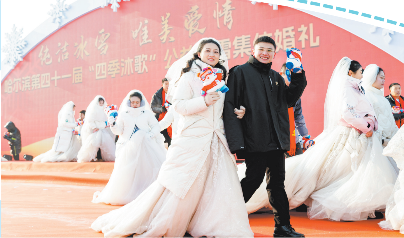
1月6日,在哈尔滨冰雪大世界园区,新人参加公益冰雪集体婚礼。当日,作为哈尔滨国际冰雪节重点活动之一的哈尔滨第四十一届“四季沐歌”公益冰雪集体婚礼在哈尔滨冰雪大世界举行,来自全国17个省(区、市)的43对新人在冰雪中喜结良缘。