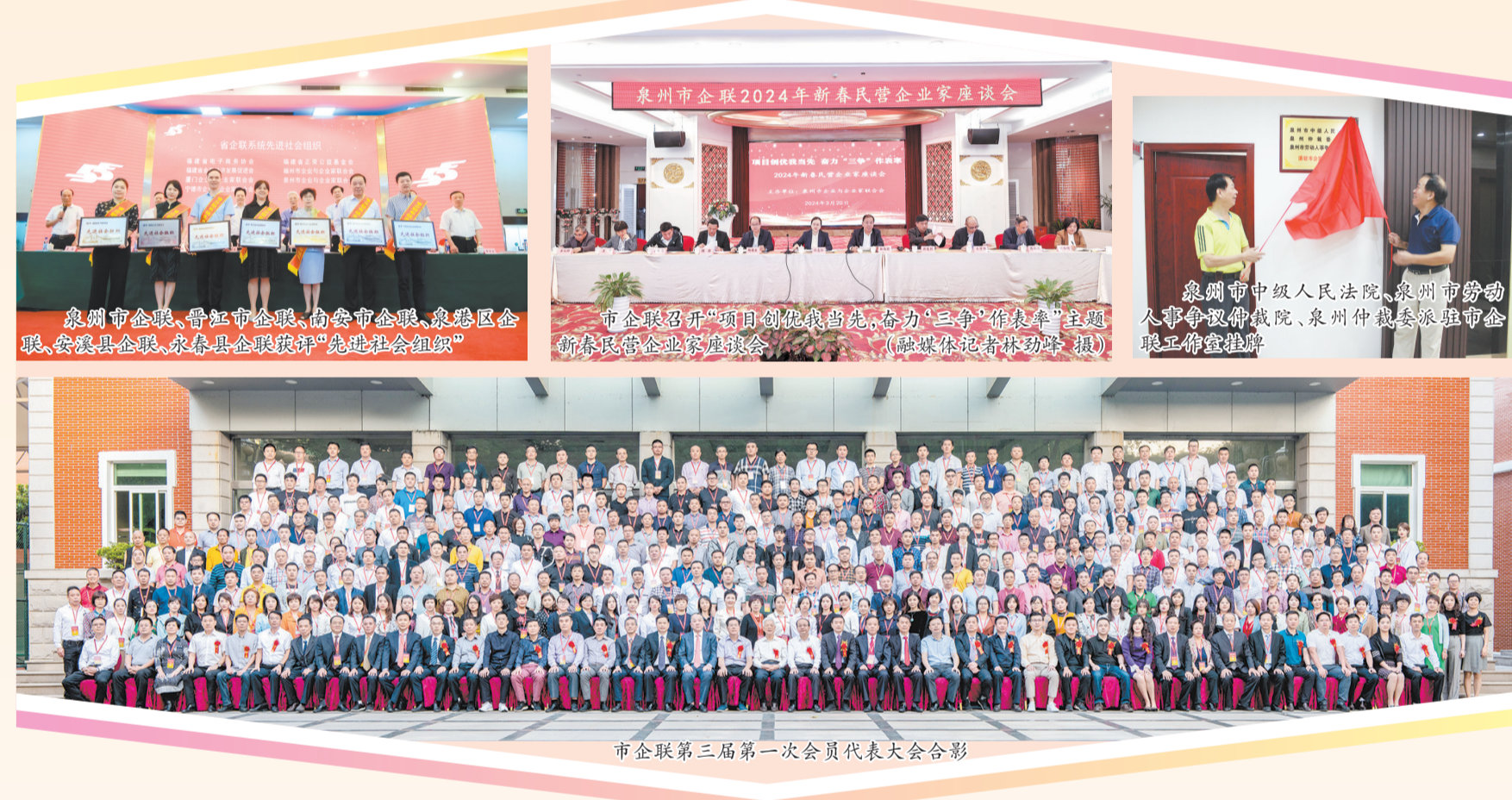
市企联第三届第一次会员代表大会合影