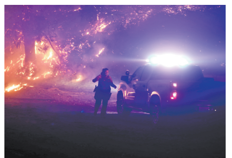
1月7日,一名警察在美国加利福尼亚州南部洛杉矶县沿海社区帕西菲克帕利塞兹的野火旁工作。美国加利福尼亚州南部洛杉矶地区野火持续肆虐,截至8日下午已造成至少5人死亡、至少1100栋房屋损毁。根据洛杉矶县警方通报,该地区目前有至少5处危险性野火蔓延。(新华)

据悉,上述四处警察厅可动员人数将超过900人,加上1月3日首次尝试抓捕尹锡悦时出动的人员,再次抓捕尹锡悦时将可能动员超1000人加入抓捕队伍。(央视)