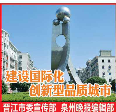
建设国际化 创新型品质城市 晋江市委宣传部 泉州晚报编辑部