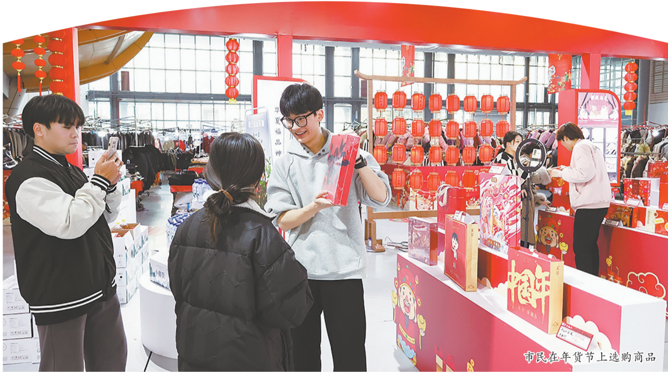
市民在年货节上选购商品

本报讯 1月8日,首届石狮服饰优品年货节暨华夏福品神州行活动启动仪式、第27届海博会倒计时100天新闻发布会在石狮服装城展览艺术中心举行。