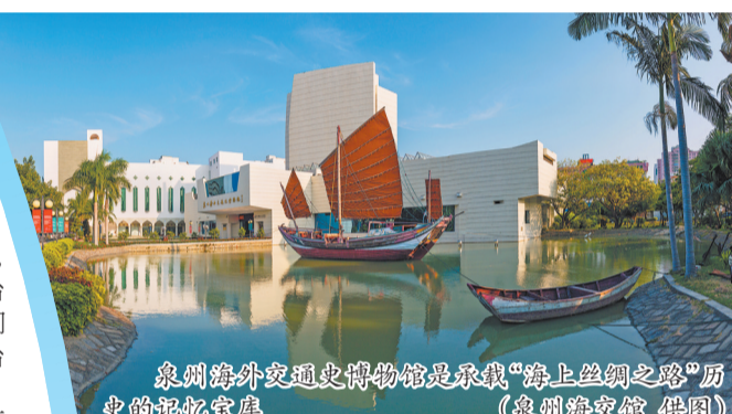
泉州海外交通史博物馆是承载“海上丝绸之路”历史的记忆宝库