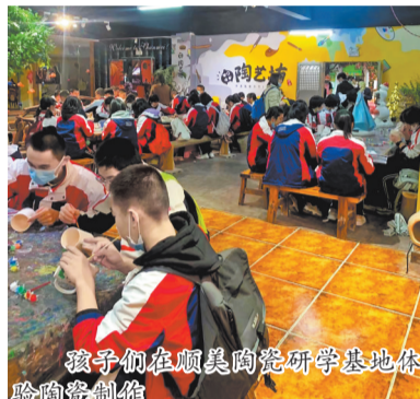
孩子们在顺美陶瓷研学基地体验陶艺制作。