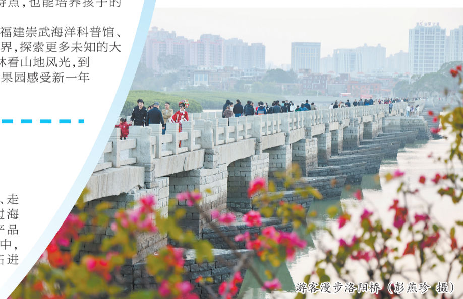
游客漫步洛阳桥