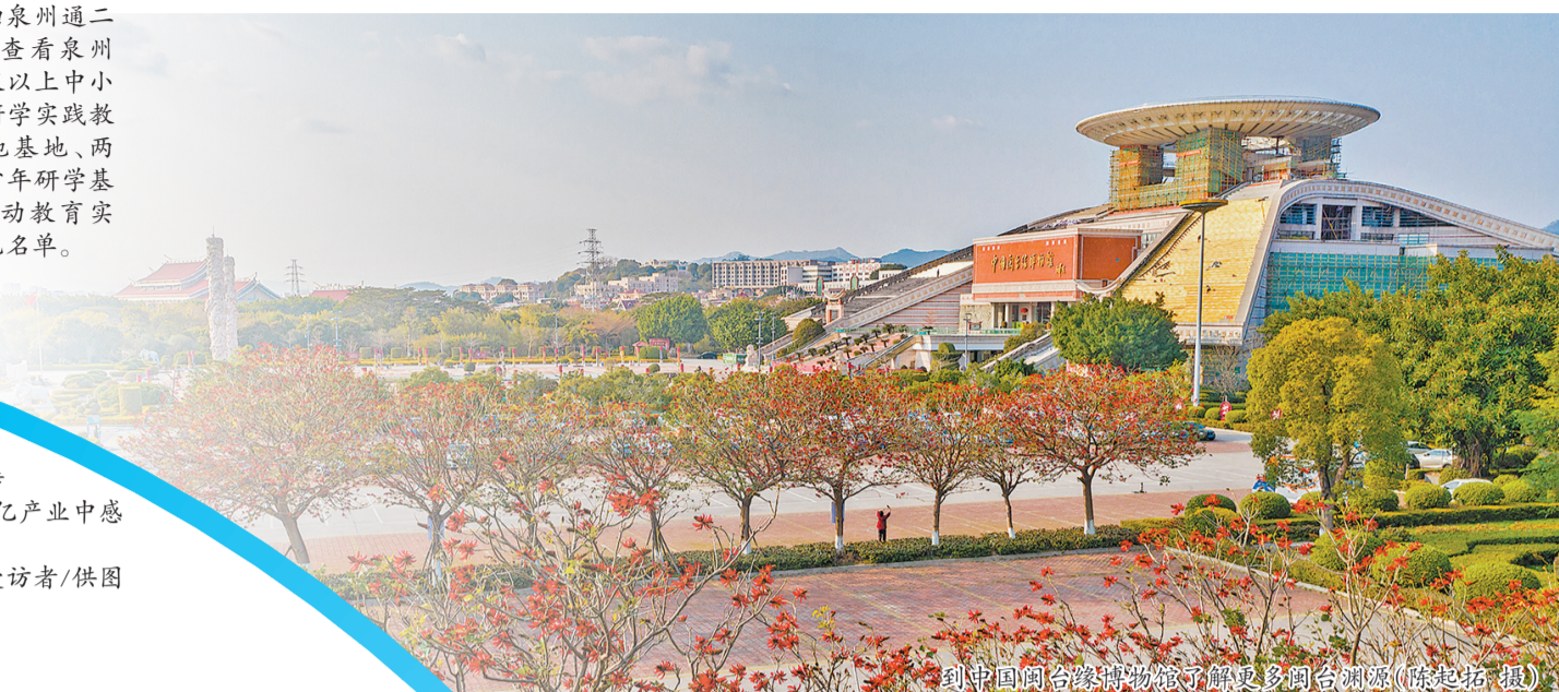
到中国闽台缘博物馆了解更多闽台渊源

茗香万里的安溪茶、走遍全球的晋江鞋、漂洋过海的德化瓷,泉州的国潮产品持续出海。从企业的发展中,便能看见泉州人的开拓进取、敢为天下先的精神,这必能赋予研学之旅不一样的意义。