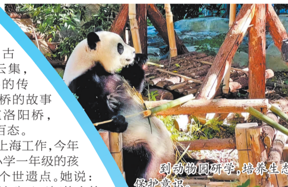
到动物园研学,培养生态保护意识。