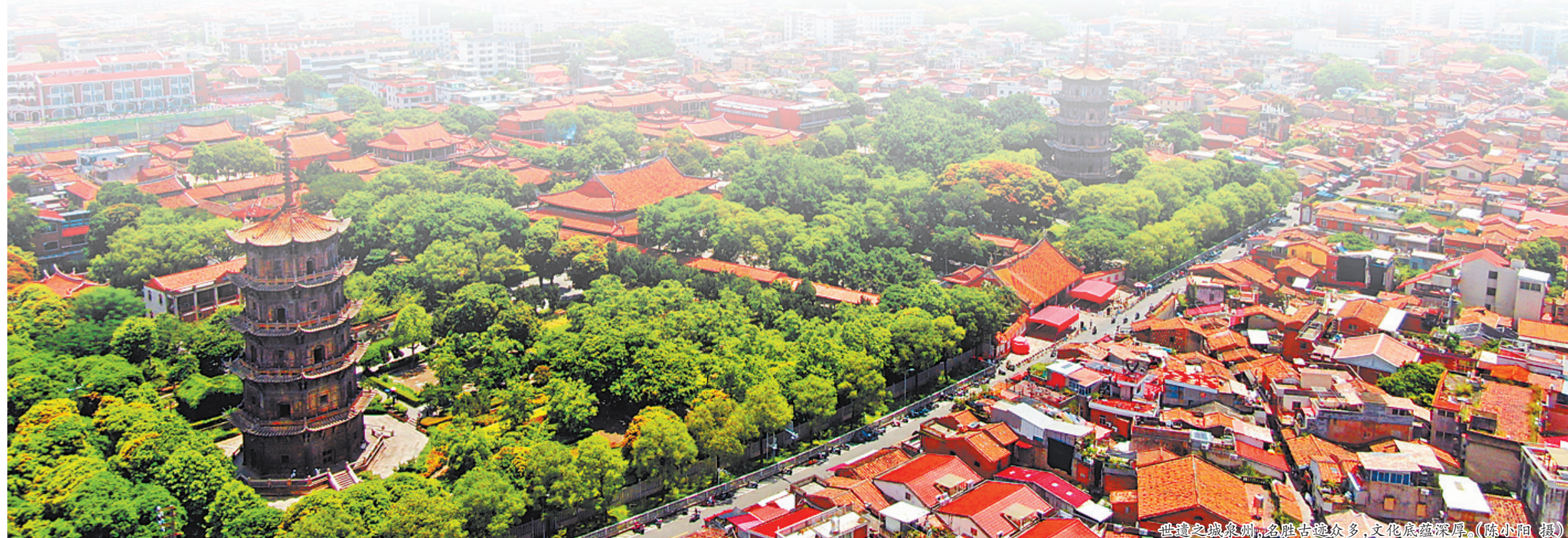
世遗之城泉州,名胜古迹众多,文化底蕴深厚。