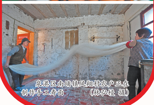
泉港区南埔镇凤翔村农户正在制作手工寿面。