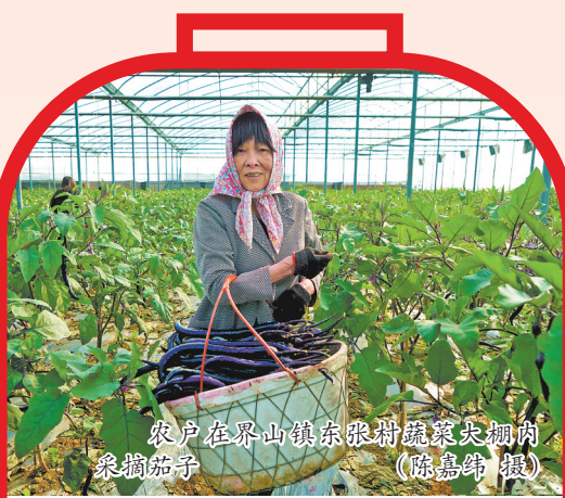
农户在界山镇东张村蔬菜大棚内采摘茄子。