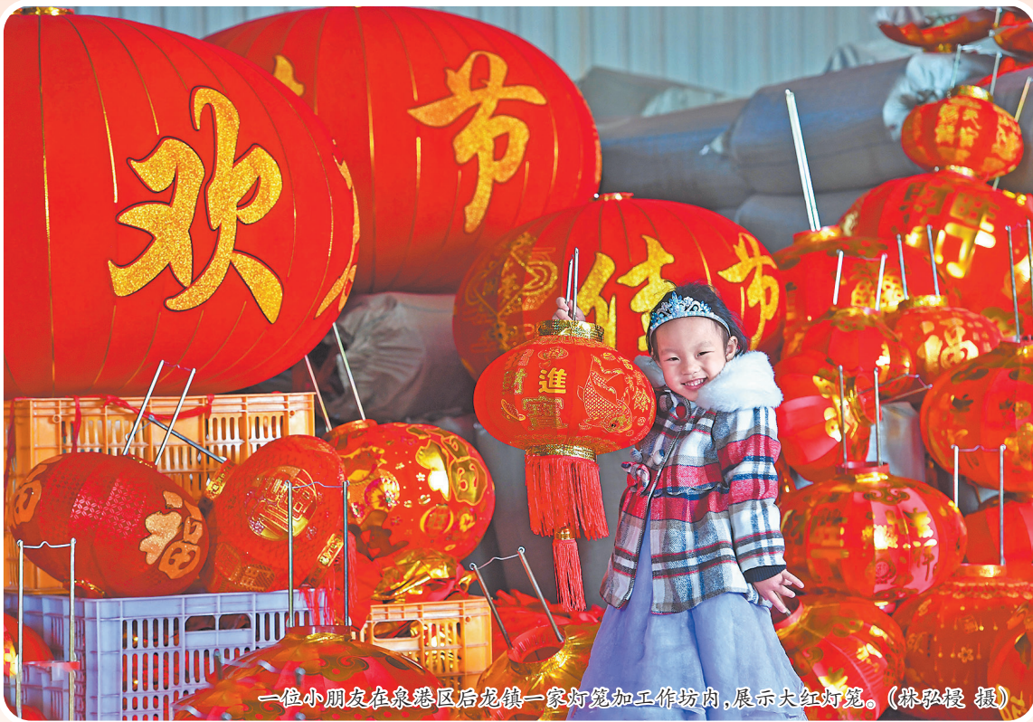
一位小朋友在泉港区后龙镇一家灯笼加工作坊内,展示大红灯笼。

泉港,一座山海宜居美城,不仅以繁荣的经济和灿烂的文化吸引无数目光,更以众多独特的风味美食让人流连忘返。春节临近,商业街上的老字号、食品店里人头攒动,鲜花、鱼市也出现客流增长。大家忙着选购自己心仪的商品,迎春节、添喜庆。