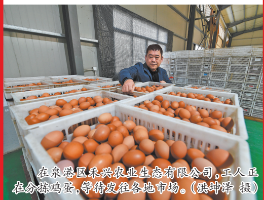
在泉港区永兴农业生态有限公司,工人正在分拣鸡蛋,等待发往各地市场。