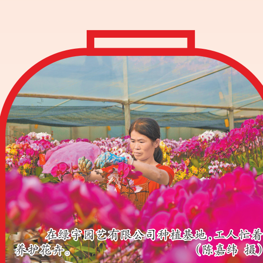
在绿宇园艺有限公司种植基地,工人忙着养护花卉。

据了解,泉港区现有主要蔬菜生产企业7家,在田蔬菜面积2950余亩,可供应上市蔬菜2059亩,日供数量可达151吨。现有生猪存栏5.34万头,日均出栏约250头;蛋鸡存栏29.3万羽,日产蛋约15吨;鱼、虾、蟹等成品水产品存塘量250余吨。泉港区农业局相关负责人表示:“春节期间,每日可供外运蔬菜50余吨、鸡蛋20余吨,日屠宰生猪350余头,水产品上市15余吨,可有效保障全区市场供应。”(洪坤泽)