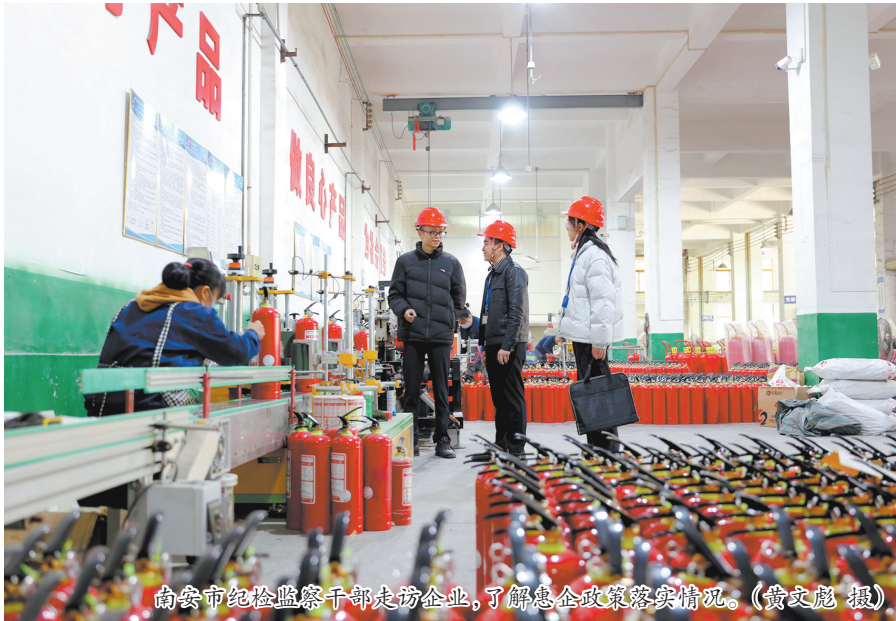
南安市纪检监察干部走访企业,了解企业政策落实情况。

同时,该市纪检监察机关牢牢把握政治巡察定位,深化实施市镇“1+N”异地交叉联动巡察模式,探索运用“审巡纪”联动监督方式,构建巡察成果“整改—评估—运用”闭环管理机制,聚焦巡察发现的某个领域内普遍性倾向性问题、群众反映强烈的