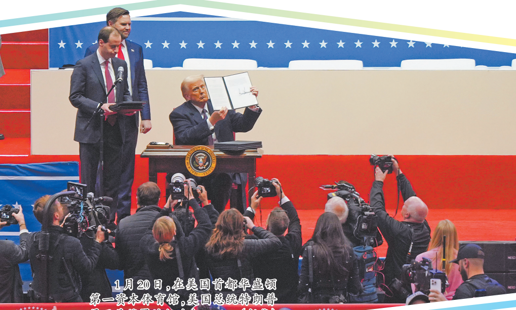
1月20日,在美国首都华盛顿第一资本体育馆,美国总统特朗普展示其签署的行政令。

美国东部时间20日中午,特朗普在国会大厦圆形大厅宣誓就任美国第47任总统,时隔四年后开启第二任期。分析人士认为,特朗普当天的就职演讲以及发布的新政策具有“美国优先”特点和单边主义色彩。围绕就典礼的一系列事件再次凸显美国政治极化,特朗普上台后美国社会撕裂恐将进一步加深。