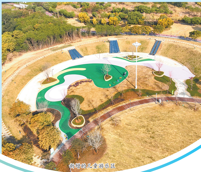
新增的儿童游乐区