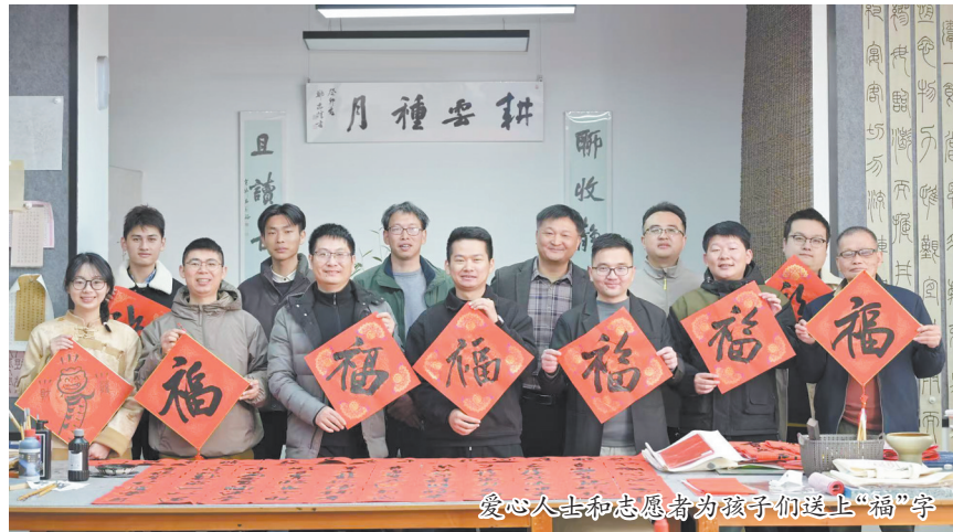
爱心人士和志愿者们为孩子们送上“福”字

此次“情暖瓷都·福泽蓓蕾”活动,不仅为困境未成年人提供物质上的帮助,也给予了他们精神上的慰藉和鼓励。寒冬虽冷,但爱暖人心扉。这场入户关怀活动,让困境儿童感受到社会大家庭的温暖,为他们点亮了新春的希望。