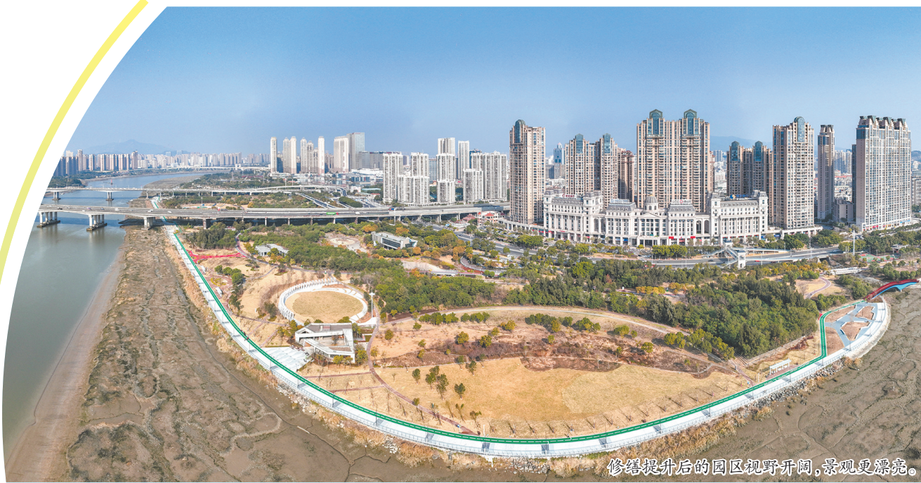
修缮提升后的园区视野开阔,景观更漂亮。