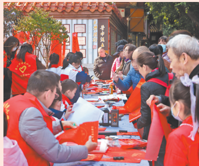
晋光小学师生为居民送上散发着墨香的新春祝福