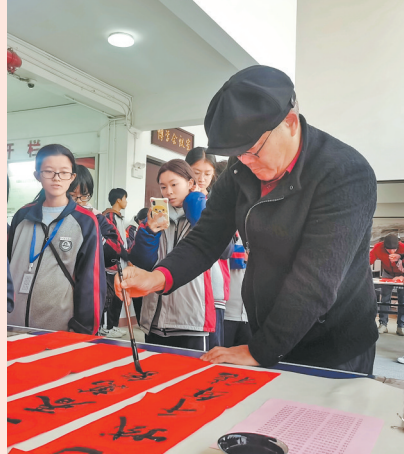
泉州农校师生一笔一画凝聚新春美好祝愿