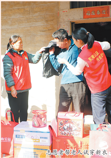
志愿者帮老人试穿新衣

活动当天,爱心团队先后慰问该中心的6名失能老人,他们在工作人员悉心照料下安享晚年。此后,爱心团队继续前往