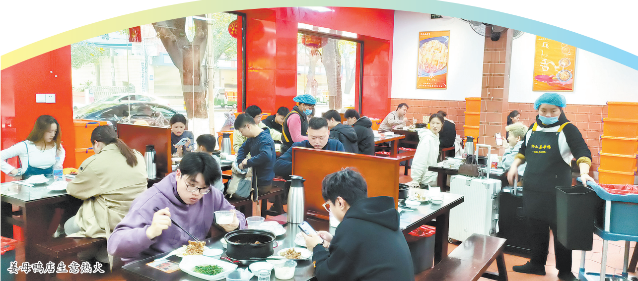
姜母鸭店生意火热

香气四溢的姜母鸭、鲜香甘甜的面线糊、软糯Q弹的海蛎煎、酥脆可口的炸醋肉……作为千年古城,泉州有着众多独具特色的美食,吸引着无数游客慕名而来。首个非遗中国年即将到来,不妨来泉州品尝美食,在畅游泉州的同时,享受一场特有的味蕾狂欢,沉浸式体验舌尖上的泉州。