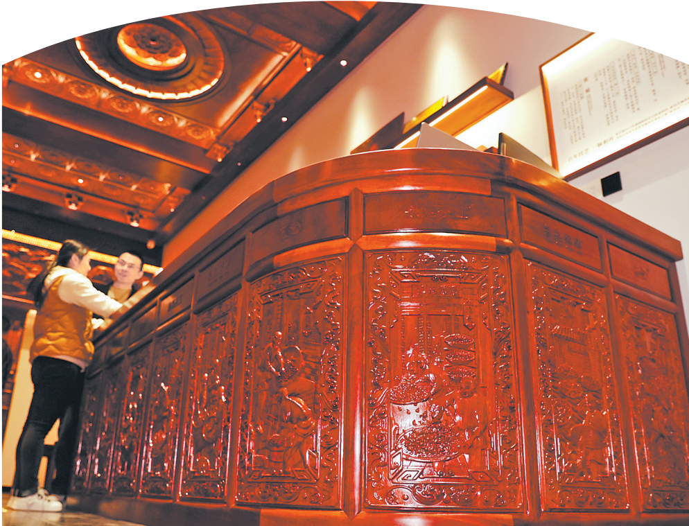
制茶技艺雕刻在柜台侧面