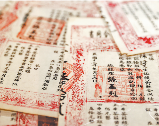
当年茶庄往来票据