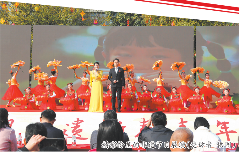
精彩纷呈的非遗节目展演