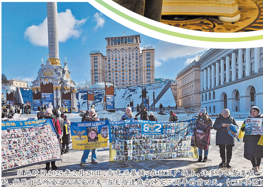
当地时间2025年2月20日,乌克兰基辅,在独立广场上,许多市民聚集在一起,祝愿自己所爱之平安归来。当天恰逢俄乌冲突三周年的前四日。