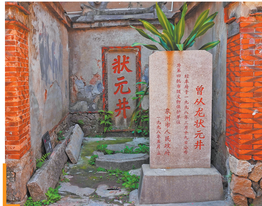
曾从龙裔孙曾士谦在1809年题写的“状元井”