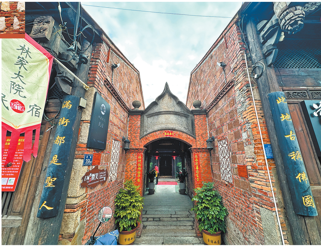
中西合璧的林家门造型别致美观