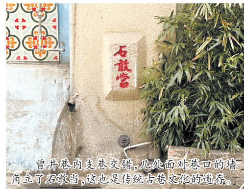
曾井巷内支巷交错,几处面对巷口的墙角立了石敢当,这也是传统古巷文化的遗存。