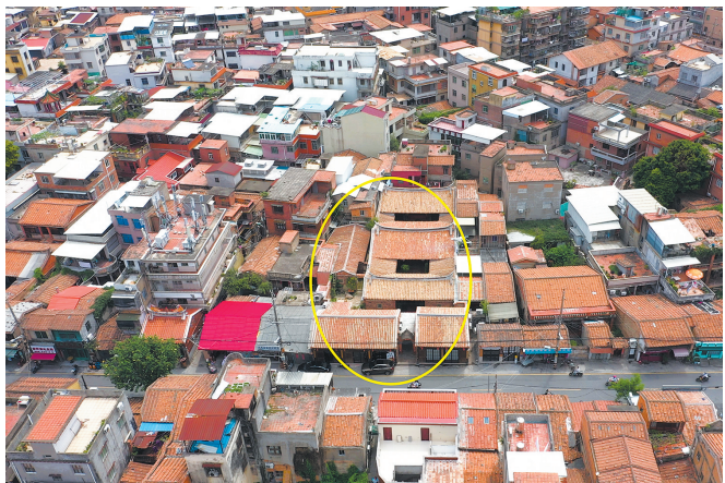
林家大厝正门在西街356号

曾井巷2号与西街356号曾经都属于林家大厝,这座大厝始建于1911年,户主林志育与翁淑荣夫妇重视教育,育有8个子女,包括4男4女,4个儿子包括原中国交通部副部长林祖乙、厦门大学原校长林祖庚、湖南大学教授林祖勋、高级工程师翁志恩,女儿们也在教育、医学、科技等行业崭露头角、各有建树。