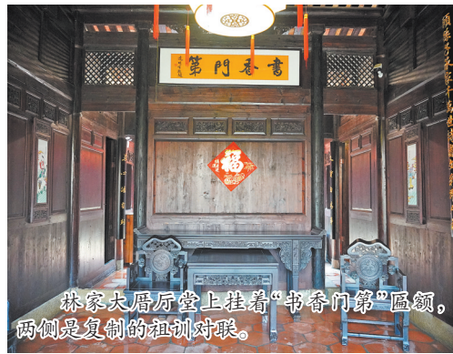
林家大厝厅堂上挂着“书香门第”匾额。两侧是复制的祖训对联。