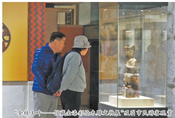
“金枝玉叶——馆藏金漆彩绘木雕文物展”吸引市民驻足观赏

本报讯 “金枝玉叶——馆藏金漆彩绘木雕文物展”本月起在泉州市博物馆正式开展。本次展览设置了“木雕发展的历史脉络与运用”“木雕与彩绘、金漆的完美结合”“传统木雕工艺与纹饰艺术”“泉州木雕工艺的典范”四大展区,全方位展示了泉州木雕工艺的历史沿革,生动诠释了其工艺之精湛与艺术之魅力。