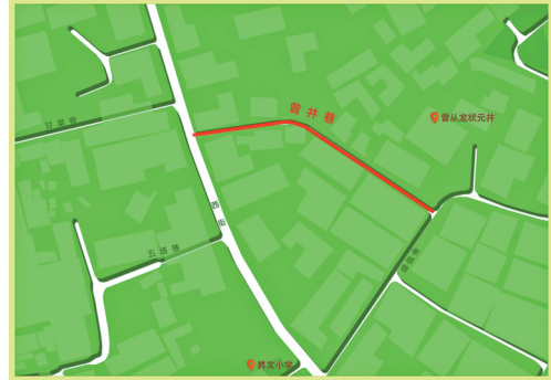
曾井巷示意图(陈慧芬 制图)