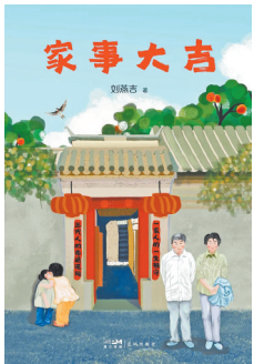
刘燕吉 著 花城出版社

这是一部始自20世纪初的“家事”,讲述了一北一南两个家族四代人近一个世纪的故事。丈夫黄伯瑜出身于闽南书香世家,妻子刘燕吉的家族曾是华北平原的乡绅家庭,年龄相差近10岁的两人,命运在北京聚合交织。这些故事不仅是家事,也是普通人的一生所遇。年近九旬的大吉,从岁月洪流中打捞出珍贵记忆,历经时光,无坚不摧。有惊涛骇浪,更有温情相守,于良善、质朴与坚韧中传递生生不息的力量。