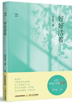
《好好活着》 贺彦豪 著 北岳文艺出版社