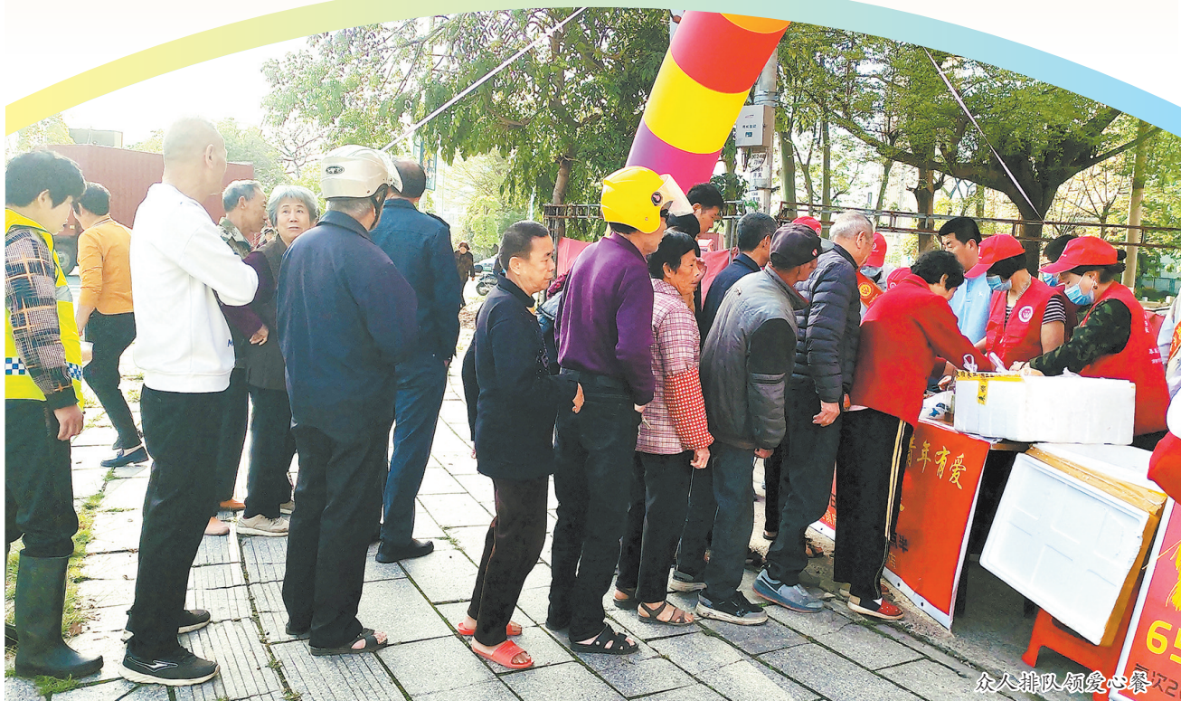
众人排队领爱心餐