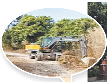
▲正在改造的昌林山路