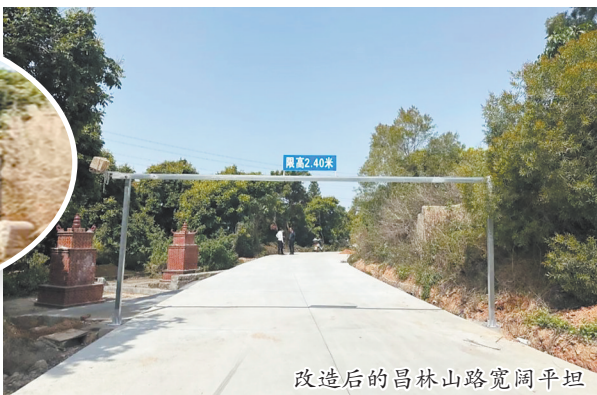
改造后的昌林山路宽阔平坦

本报讯(融媒体记者宋万春/文 受访者/图)近日,晋江市磁灶镇张林、太昌、东山三村合力改造的昌林山路正式竣工通车。改造后的道路宽阔平坦,取代了昔日狭窄难行的土路,为当地村民带来了便利。