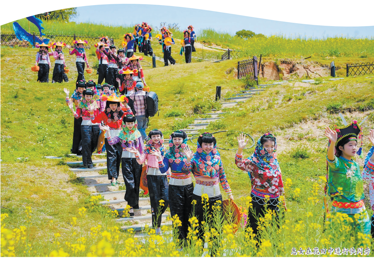
惠女在花田中进行快闪秀

据了解,为突出惠女服饰特色文化,进一步挖掘推广惠女特色文化旅游,为“五一”惠女服装秀和旅拍摄影活动预热造势,惠安县共将举行“镜中惠女·情满海丝”4场摄影活动,包括“花漾惠女”油菜花田快闪秀以及“古厝惠女”“海韵惠女”“时尚惠女”3场活动。