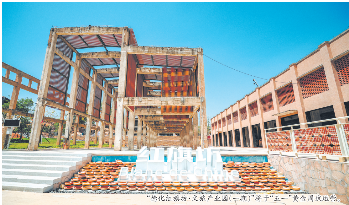
“德化红旗坊·文旅产业园(一期)”将于“五一”黄金周试运营。

在德化,有一座承载着几代人记忆的老厂——红旗瓷厂。它诞生于上世纪50年代,曾是德化陶瓷工业化的象征,生产的白瓷远销海外。斑驳的红砖墙、高耸的老烟囱、锈迹斑斑的窑炉……一腔炉火,在城市化浪潮中倔强地留存着74年。谈及这座曾经的德化国营瓷厂,可以说是德化陶瓷现代化大工业生产的历史见证,是新中国成立以来最具有代表性的老瓷厂之一,薪火相传下,仍旧是承载泉州几代工匠千年窑火的精神容器。