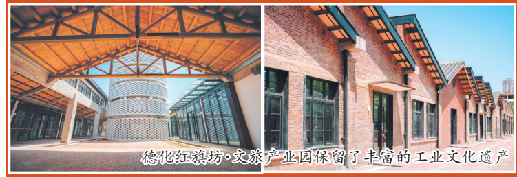
德化红旗坊·文旅产业园保留了丰富的工业文化遗产

聚焦陶瓷主题,“五一”试运营期间,在园区文化博览区,将举办2025德化红旗坊陶瓷艺术精品展。展览设五大展区,展陈内容涵盖了德化“中国白”中国传统陶瓷艺术双年展艺术精品精选展品、大师艺术瓷、出口瓷、日用瓷、泉州工艺美术职业学院美院师生校友作品等不同类别陶瓷精品,让游客沉浸式领略德化千年陶瓷文化的深厚底蕴。