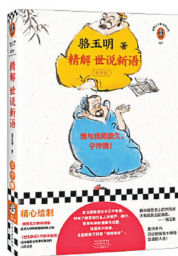
骆玉明 著 河南文艺出版社

如果你想要活成自己期望的样子,那一定能在《世说新语》的故事里找到共鸣。痛饮、狂歌、躺平……魏晋人早就尝试过了。《精解世说新语》源自骆玉明教授在复旦大学讲授20年的《世说新语》解读课程,内容浅易却不浅薄,分13个专题阐释《世说新语》中魏晋时代士人对尊严、德性、智慧和美的理解与热爱,涵盖魏晋南北朝的诸多热门话题。