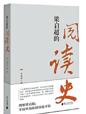
石珠林 著 广东南方日报出版社

此书从梁启超的早年学术启蒙切入,细致梳理其阅读历程,展现他如何通过广泛涉猎中西学问,构建起独特的知识体系与思想风格。书中不仅详细记述了梁启超在日本的学术探索,以及对佛教历史的深入钻研,还探讨了他在文学创作方面的创新及产生的影响。作为一部融合历史研究与文学分析的著作,本书力图揭示这位伟大思想家的学术根基与知识结构的部分面貌,为读者了解梁启超及其所处时代,提供了珍贵的视角与资料。