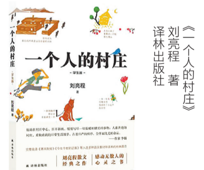
《一个人的村庄》 刘亮程 著 译林出版社

总之,《一个人的村庄》值得大家一读再读,它像一个宁静港湾,当你累了倦了,不妨乘着这文字的诺亚方舟,轻轻荡漾。