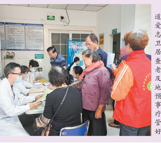
丰泽区委宣传部 泉州晚报编辑部