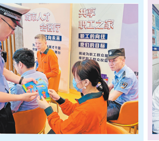
丰泽区委宣传部 泉州晚报编辑部