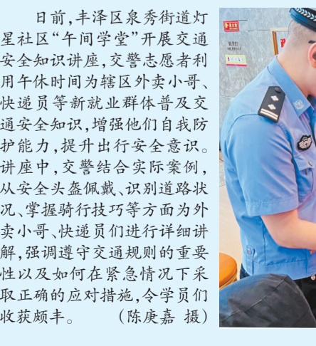
丰泽区委宣传部 泉州晚报编辑部

整场讲座站位高远，内容丰富，案例典型，具有很强的理论性和指导性。与会学员纷纷表示，课堂上强调的“系统性保护”“法治化保护”理念令人受益匪浅，在未来的工作中将提高政治站位、心存历史敬畏、坚定文化自信，自觉增强文物保护意识，提升文物保护利用工作，大力推动丰泽区文物保护工作再上新台阶，助推21世纪“海丝名城”核心区建设。(张婧滢)