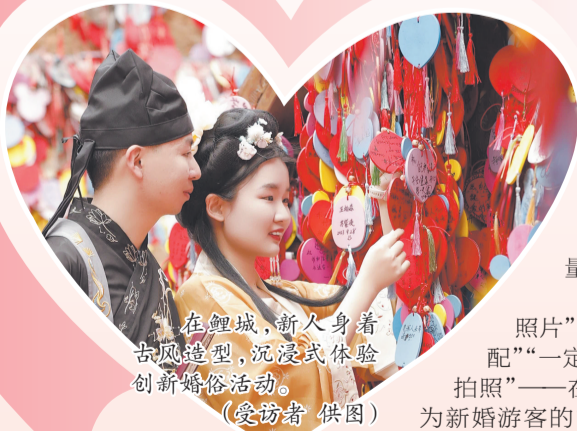
在鲤城,新人身着古风造型,沉浸式体验创新婚俗活动。

位于泉港区的颐爱公园婚姻登记点于去年5月20日正式揭牌并常态化开放。园区内设有9座爱情主题建筑、2处爱情码头、4个爱情主题岛、3个附属岛,占地383亩,是一座名副其实的爱情主题湿地公园,只要提前预约,新人即可于法定工作日内在此完成婚姻登记。漫步其间,只见桑青碧水、竹林摇曳、白鹭翩跹、鱼跃清波,在相思渡码头许愿,在绣球阁前合影,在月老阁系上姻缘红线,或是在粉色沙滩留下爱的足迹……这座“有爱”的公园,处处都是绝佳的领证打卡点。