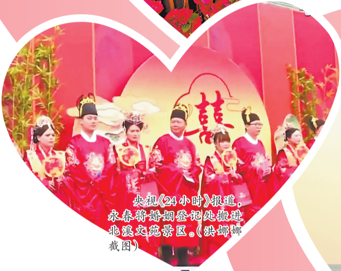
央视《24小时》报道,永春将婚姻登记处搬进北溪文苑景区。