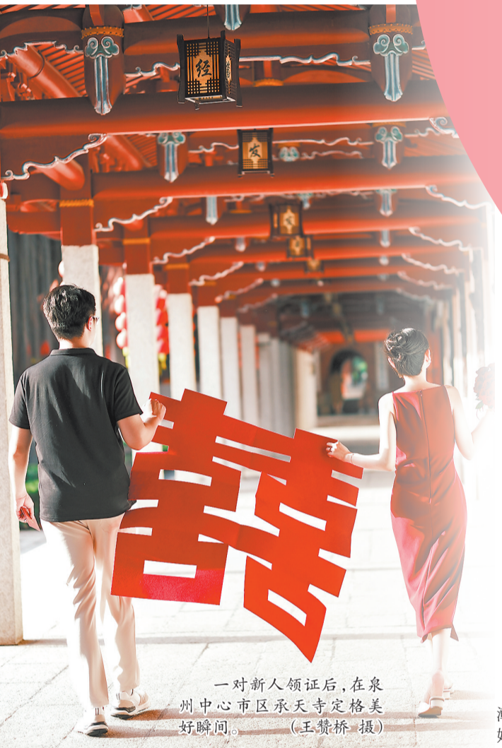
一对新人领证后,在泉州中心市区永天寺定格美好瞬间。