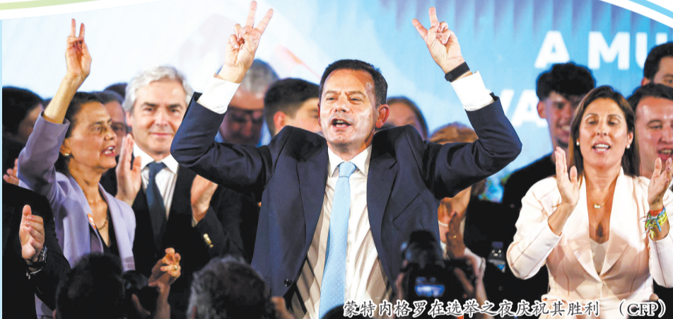
蒙特内格罗在选举之夜庆祝其胜利

本次选举是葡萄牙在不到4年内第三次提前举行议会选举。本次选举情况怎样?极右翼政党缘何崛起?未来政局走向如何? □新华