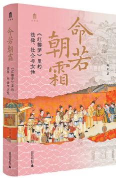
《命若朝霜》 柯岚 著 广西师大出版社

《命若朝霜》深刻揭示了封建礼法制度对人性的压抑和摧残,也呈现出女性在困境中的觉醒、挣扎和不屈的力量。《红楼梦》中那些令人叹息的悲剧已成为历史,唏嘘过后,我们应该明白:尊重每个人与生俱来的价值与尊严,保障每个人自由追求梦想、获取幸福的权利,是文明社会永恒的追求。