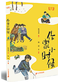
《作家小时候》 陈诗哥 主编 二十一世纪出版社

和伙伴们嬉戏,可以更多地有趣的自在做事、听声、闻味,感受着不明来路却充满神秘的点点滴滴。很显然,他们是快乐的,享用的是更纯粹、更深刻、与生命成长更密切相关的快乐。对童年来讲,有什么比真正的快乐更重要呢?足够快乐的童年,是一生享用不尽的福利。对作家尤其是儿童文学作家来讲,它是永不枯竭的源泉。