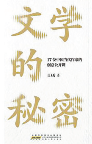
江玉婷 著 安徽人民出版社

本书记录了作者与刘心武、梁晓声、周大新等17位当代文坛著名作家的深度对话,聚焦于作家创作前期准备、写作风格形成和典型形象塑造等重要文学议题。书中对《钟鼓楼》《人世间》《湖光秋色》等经典作品进行多维度剖析,是一部兼具方法指导价值的精品文学普及读物。书中深入解读相关作品的审美意趣与创作观念,对于展现当代文学创作成果、彰显当代作家创作风采,以及帮助读者理解文学作品中讲述的中国故事,均具有重要意义。