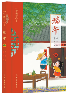
《端午》 苏瑾 萧一闲 著 五洲传播出版社

国泰民安,端午安康。《端午》以丰富的史料、生动的叙述,全景式展现了端午这一传统节日的魅力。读完此书,我们不仅能了解端午的习俗、历史与文化内涵,更能在内心深处唤起对传统文化的热爱与敬畏。在现代社会,传统文化面临诸多挑战,此书如同一座桥梁,连接起过去与现在,让古老的端午文化焕发出新的生机。珍视传统节日这一文化遗产,守护和弘扬中华优秀传统文化,正是我们对民族精神的传承与延续。