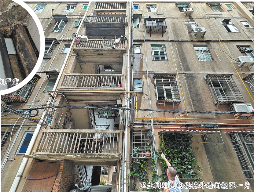
卫生间那侧的楼体外墙面潮湿一片