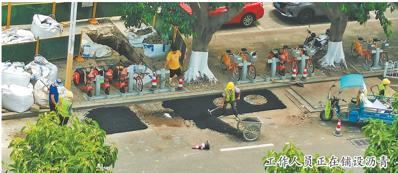
工作人员正在铺设沥青