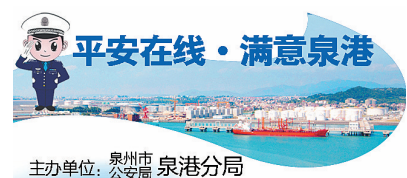
主办单位: 泉州市 泉港分局

“航程”终有泊岸,守护永无止境。未来,泉港公安将继续用忠诚和担当,守护全民幸福安宁。