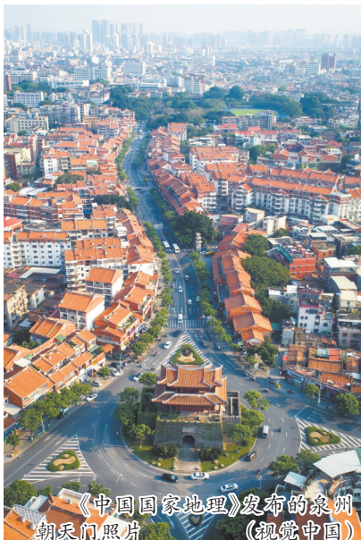
《中国国家地理》发布的泉州朝天门照片