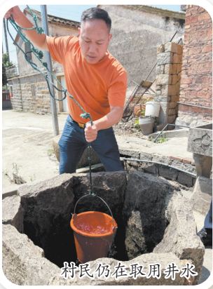
村民仍在取用井水