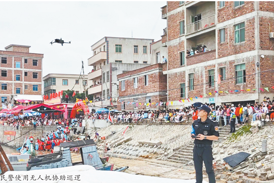
民警使用无人机协助巡逻

本报讯(融媒体记者张雯 通讯员林君文/图)端午期间,泉港沙格龙舟赛如期举行,泉港公安安全警动员,周密部署,落实、落细各项安保措施,确保龙舟赛顺利进行。