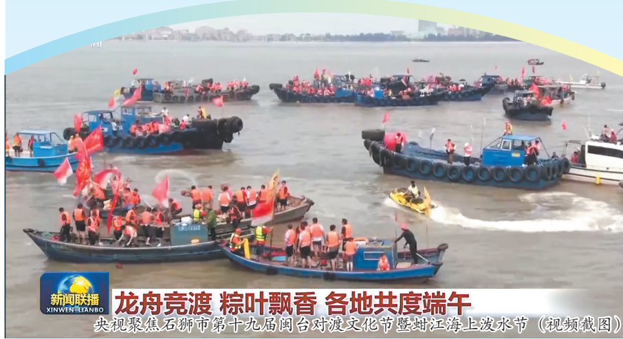
龙舟竞渡 粽叶飘香 各地共度端午