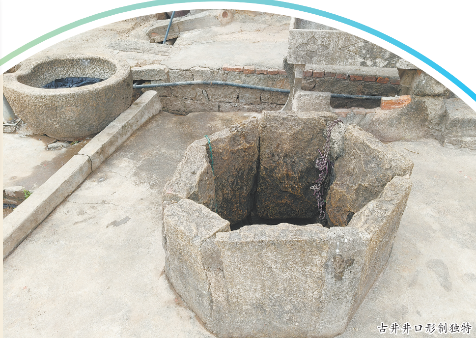
古井井口形制独特

近日,泉港区第四次全国文物普查(以下简称“四普”)第二阶段实地调查工作已基本完成转段任务。在此前的走访中,泉港“四普”工作队发现一口宋代“大街祖井”,不仅形制独特,更是泉港区目前有确切记载、年代最早的水井,有望被认定为新发现不可移动文物。