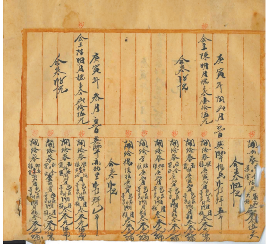
庆德会《公议部》记载了1889年蔡姓会员母亲去世,会中出银23元6角。