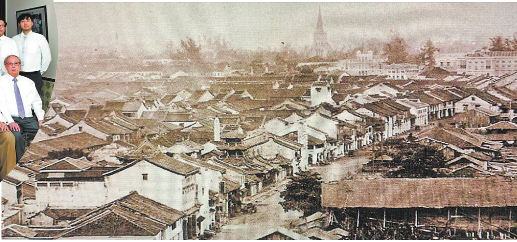
1860年的庆德楼所在地新加坡直落亚逸街,此处是当时泉漳华商聚集地。