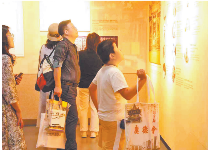
“守望相助——新加坡庆德会的故事”专题展览在泉举办