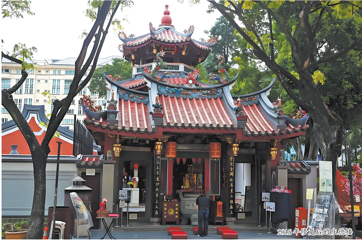
2015年修复后的庆德楼