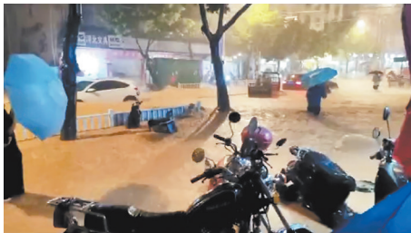
暴雨导致德化县城部分路段积水