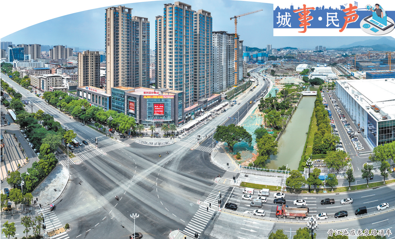
晋江池店龙泉路通车

晋北区域东西向通道空白,建成后,将陆续串联起经二路、经三路及池峰路南延伸主动脉等片区南北通道,为池店中片区的全面开发建设提供基础保障。”池峰路南延片区改造项目指挥部工作人员表示。