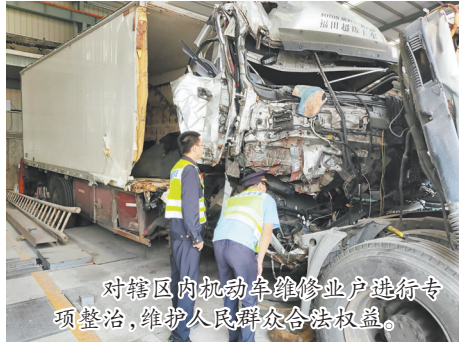
对辖区内机动车维修业户进行专项整治,维护人民群众合法权益。

本报讯(融媒体记者王金植 通讯员王梅芳 林志斌 文/图)即日起,泉港区交通运输局深入开展机动车维修行业专项整治行动,聚焦机动车维修行业违法违规运行问题,维护人民群众合法权益。