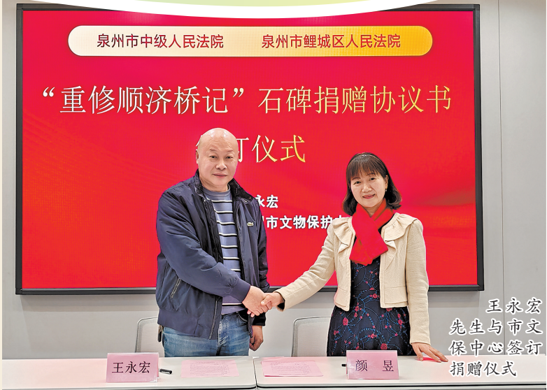
泉州市中级人民法院 泉州市鲤城区人民法院

法官介绍,这起案件成功探索了通过“保全促协商+捐赠获认可”的处置模式,发挥法律的规制、引领作用,破解文物追索难题,促成流失文物顺利回归。