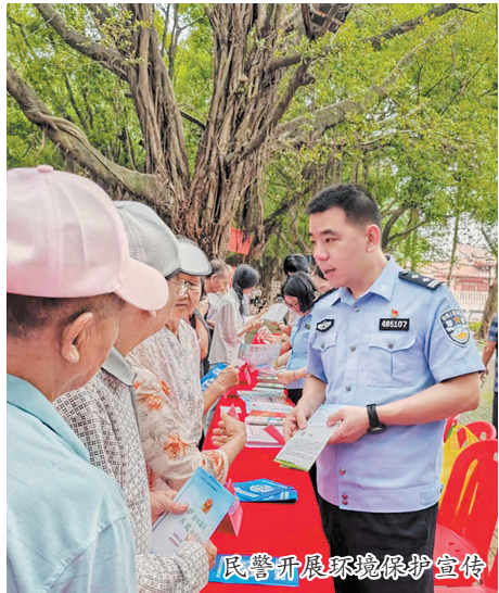
民警开展环境保护宣传

本报讯(融媒体记者张晓玲 通讯员谢艳菊 文/图)为有效提升辖区群众生态环境保护意识,让“绿水青山就是金山银山”的理念深入人心,安溪县公安局近日联合相关部门在龙潭公园开展以“美丽中国我先行”为主题的集中宣传活动。