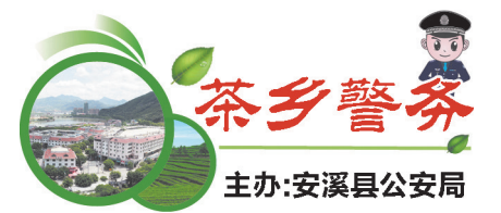
主办:安溪县公安局

通过此次宣传活动,让群众充分认识到环境保护的重要性,了解了生态环境领域犯罪相关的法律法规,进一步增强了群众生态环境保护意识,扩大了“世界环境日”宣传的覆盖面和知晓率,营造了保护环境、热爱家园的良好氛围,引导群众自觉做绿色生态环保的宣传者和实践者。