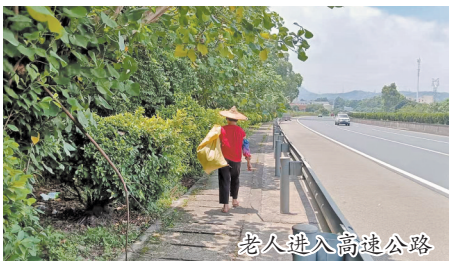
老人进入高速公路

经询问得知,老人是附近村民。因听闻某种树叶具有药用或食用价值,当天竟抱着侥幸心理,从高速公路边坡破损的铁丝网处钻入高速边坡区域,一心想着采摘树叶,全然不顾身边呼啸而过的车流潜藏着巨大危险。