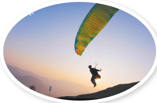
登峰基地的滑翔伞项目

圩日版块各类农特产品、民俗产品销量同比增长5倍多；夜市版块营业额同比增长3倍—5倍；辖区内各景区景点游客接待同比增长2倍多。尤为可喜的是，不管是杨梅鲜果还是杨梅酒、果脯等杨梅副产品，今年销售价均一路上涨且供不应求，预计杨梅全产业链产值超10亿元，同比增长20%以上。 多个新兴项目的背后，是南安系统化的资源整合策略：依托石材工业推出“成功石尚”工业游，入选泉州精品线路；串联蔡氏古民居、高甲戏博物馆等资源，打造浪漫春游线路；利用温泉、花田等生态资源，策划四季主题旅游产品。2025年1—4月，南安限上住宿业营收同比增长36.6%，餐饮业增长43.8%，两项指标均位居泉州前列，印证着资源盘活的实效。