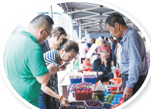
一起感受杨梅节上的丰收喜悦

夜间经济同样是这个夏天主推的重点方向，南安将借助“成功船说奇妙夜”活动，以神秘主题装饰游船，增设南音表演与灯光秀；官桥“墟游记”夜市街区也将延长营业时间，引入沉浸式剧本杀与街头艺术表演，打造“不夜闽南”新地标。另外还有啤酒节以及各个乡镇立足本地特色推出的多彩活动。 为了更好地服务暑期游客，南安更是推出诚意满满的配套消费链创新服务项目：多个景区门票特惠、新能源汽车购车抽5万元补贴……多项优惠举措持续叠加，全面打造“吃住行游购娱”全链条优惠矩阵。