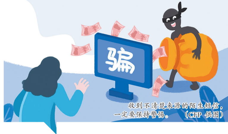
收到不清楚来源的陌生短信,一定要保持警惕。