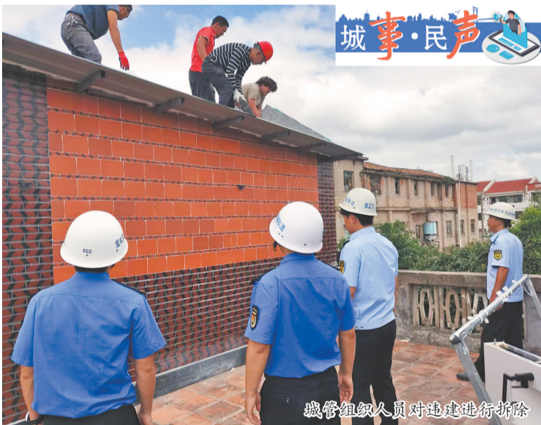
城管组织人员对违建进行拆除

今年以来,为保护泉州古城风貌,鲤城区城市管理和综合执法局持续发力,结合中山南路修缮改造工作,对中山南路屋顶存在的影响立面景观违建(构)筑物进行摸排,清单化清理整治,截至目前,已拆除中山南路“第五立面”历史搭建70宗,助推古城“第五立面”品质提升。