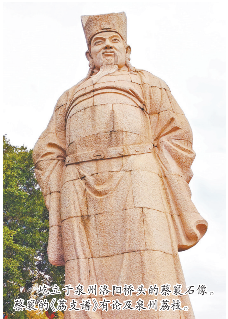
屹立于泉州洛阳桥头的蔡襄石像。蔡襄的《荔枝谱》有论及泉州荔枝。

荔枝固然色、香、味俱佳,不过保鲜期较短,常温下两到三日便开始衰败,果壳变软的同时,香味也会散去。汉代能将鲜荔枝送入洛阳,说明当时已经掌握了“冷链运送鲜荔”的技术了,到了唐代,基本就是依葫芦画瓢的事。有文献称宋徽宗曾通过“盆栽荔枝树+水陆联运”的方式将南方荔枝运至开封,而这种技术可能也源自汉、唐。