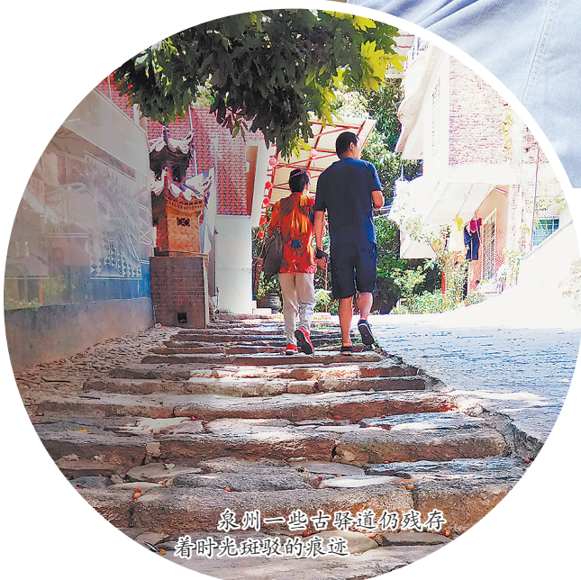
泉州一些古驿道仍留存,看时光斑驳的痕迹。

北宋蔡襄的《荔枝谱》说:“荔枝之于天下,唯闽粤、南粤、巴蜀有之。”又称:“(荔枝)闽中唯四郡有之,福州最多而兴化军最为奇特,泉州亦知名。”泉州荔枝在北宋时已经名声在外了。《荔枝话》更是描述泉州荔为“红糯半解味殷勤,白哲单衣梦亦芬”,认为泉荔“只此甘和压众香”。