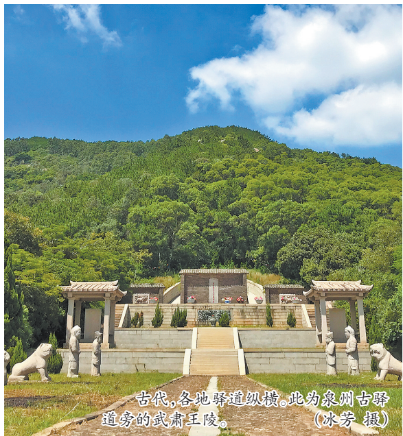
古代,各地驿道纵横,此为泉州古驿道旁的武肃王陵。

唐代所称“岭南”,是中国南方五岭以南地区的概称。五岭由越城岭、都庞岭、萌渚岭、骑田岭、大庾岭五座山组成,岭南大致包括广东、广西和云南省东部、福建小部分地区。岭南是一个历史概念,各朝代的行政建制不同,岭南建制的划分和称谓也有很大变化。从地理学上看,大庾岭主体为“东北—西南”走向,纬度高于泉州将近一半的地区,所以若要将这些区域划入唐代“岭南”范畴,理论上也是说得通的。