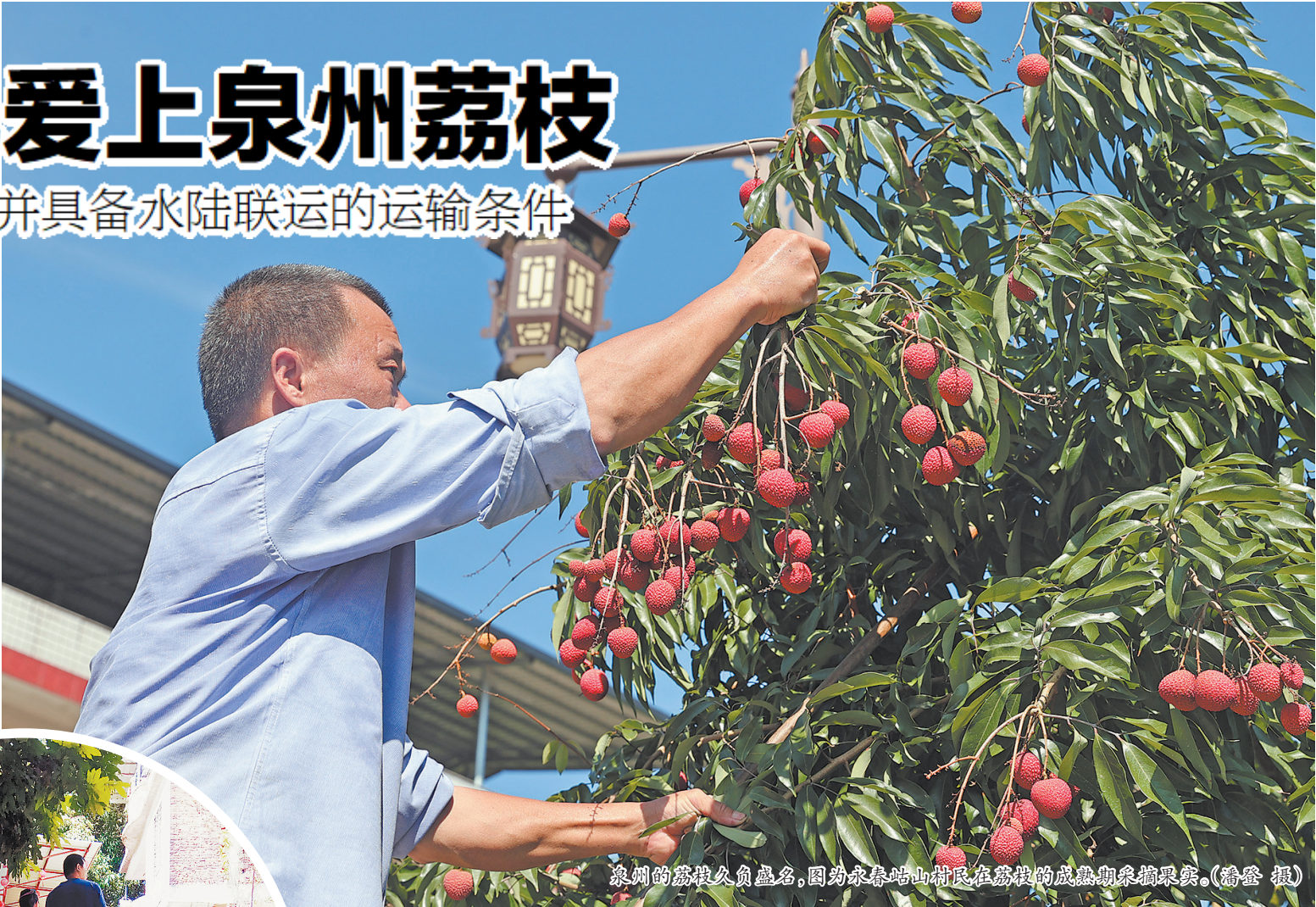
泉州的荔枝久负盛名,图为永春岵山村民在荔枝的成熟期采摘果实。