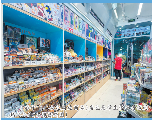
“谷子”(二次元周边商品)店也是考生这个暑假的热门去处(本报资料图)