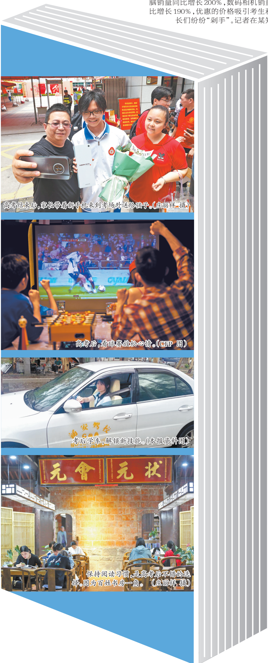
高考结束后,家长带着新手机来到考场外送给孩子。(庄丽祥摄)