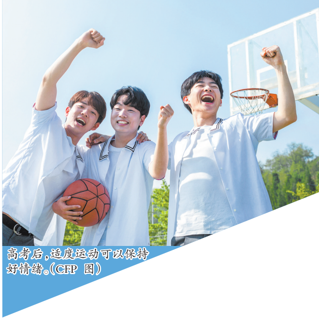
高考后,适度运动可以保持好心情。