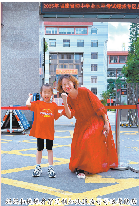
妈妈和妹妹身穿定制加油服为哥哥送考鼓劲