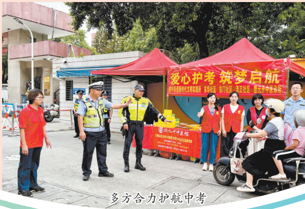
多方合力护航中考