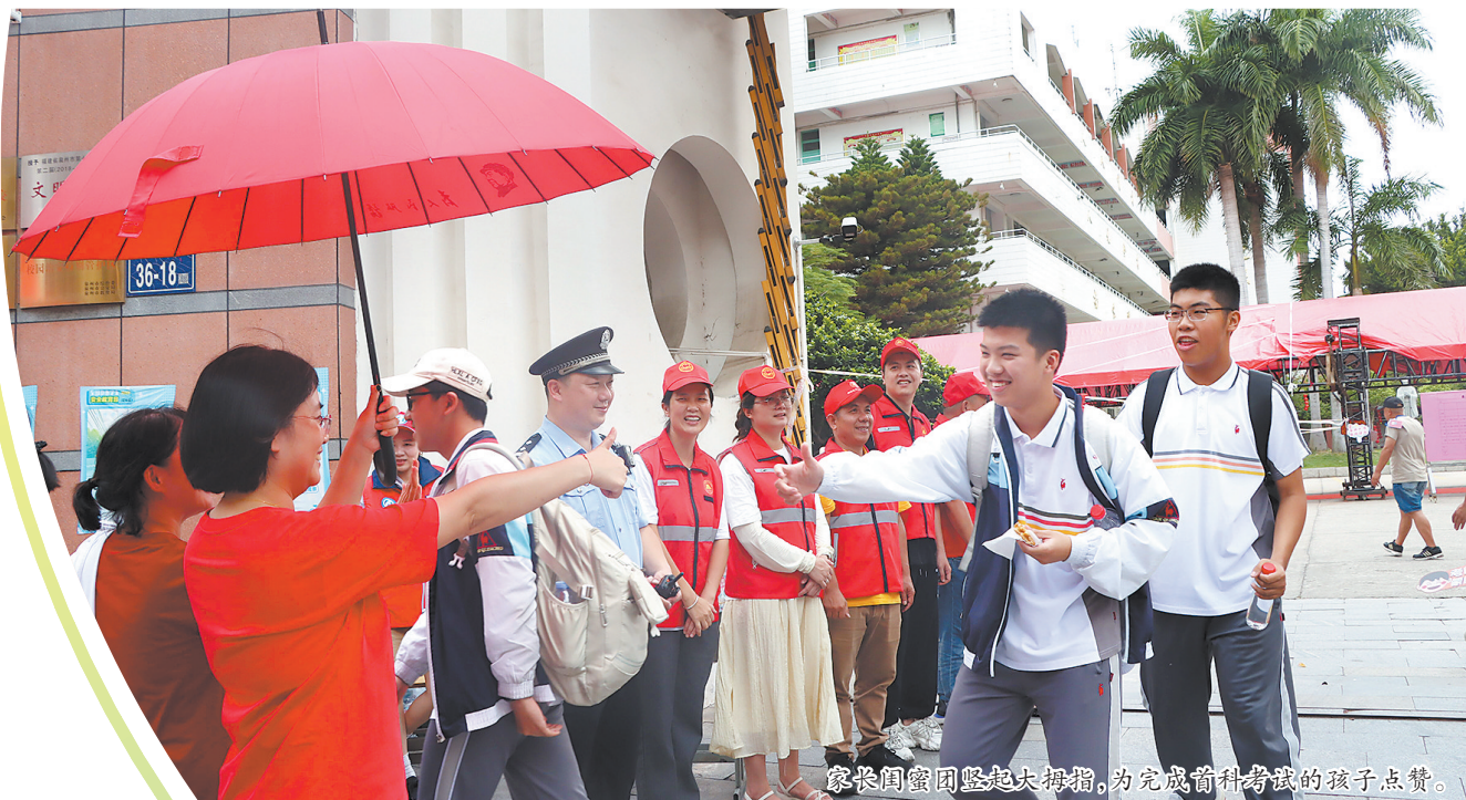
家长闺蜜团竖起大拇指,为完成前科考试的孩子点赞。