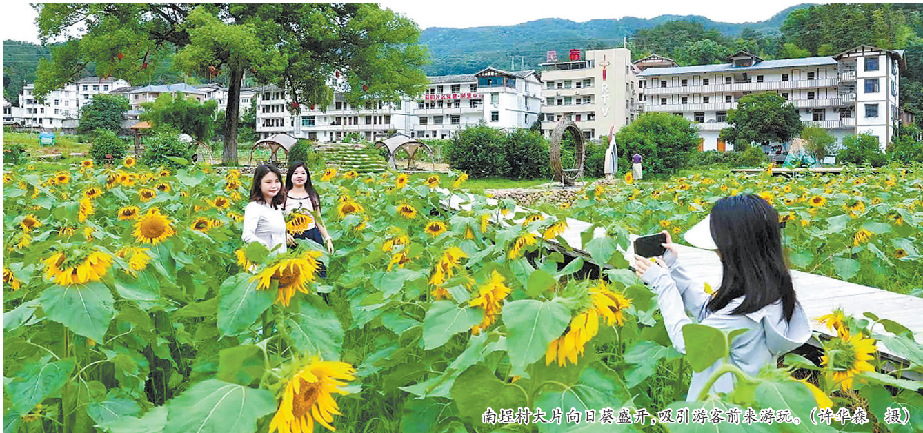
南埕村大片向日葵盛开,吸引游客前来游玩。

田野里,一些游人悠闲地享受着田园时光。草坂龙鳞坝、亲水慢道、桃花岛、古树群……5公里长的“南溪口”水文化景观道上,有紫藤花廊、河滩露