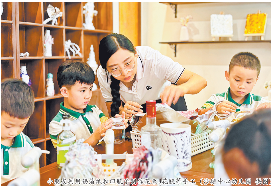
小朋友利用锡箔纸和旧瓶子制作花束、花瓶等手工

新塘街道办事处副主任金宏勃介绍,“好YOUNG新塘”是新塘街道打造的特色研学系列活动,旨在推动传统文化传承。接下来,该研学活动还将引入优质非遗内容,吸引更多家庭和幼儿参与非遗传承保护与活化工作,推动“文旅+非遗”“研学+非遗”融合发展。