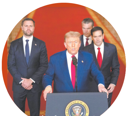
特朗普发表全国电视讲话

据伊朗塔斯尼姆通讯社22日报道,伊朗地方官员当天证实,福尔道、纳坦兹、伊斯法罕三处核设施遭袭。伊朗库姆省灾害管理部门负责人莫尔塔扎·海达里说,几小时前,福尔道核设施部分区域遭到“敌方空袭”。不过,库姆省和首府库姆市“完全平静”。伊朗伊斯兰革命卫队副指挥官阿克巴·萨利希说,“一小时前”,位于该省的纳坦兹核设施和伊斯法罕核设施附近遭袭击,传出爆炸声。防空系统启动,应对敌方目标。