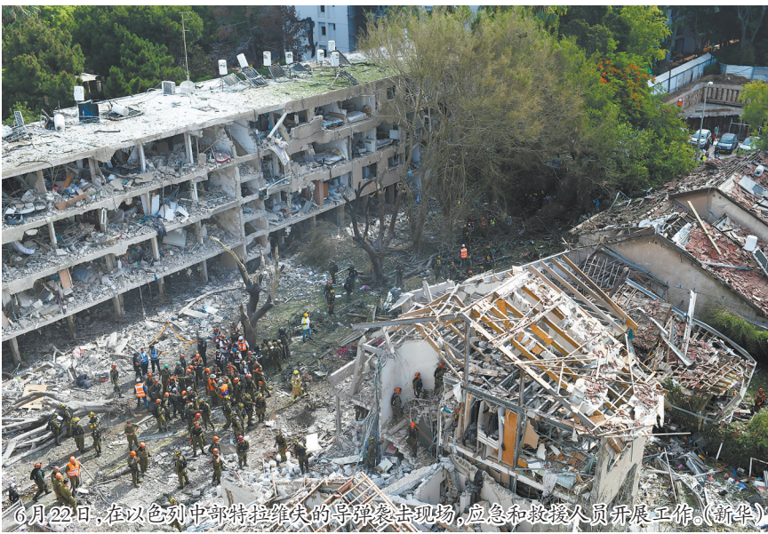
6月22日,在以色列中部特拉维夫的导弹袭击现场,应急和救援人员开展工作。(新华)

报道援引伊朗外交部22日声明称,伊朗强烈谴责美国对伊朗用于和平目的的核设施进行“野蛮军事侵略”,并表示,这一行为公然且史无前例地违反了《联合国宪章》和国际法基本原则。(中新)