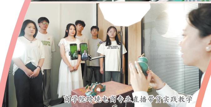
商学院跨境电商专业直播带货实践教学