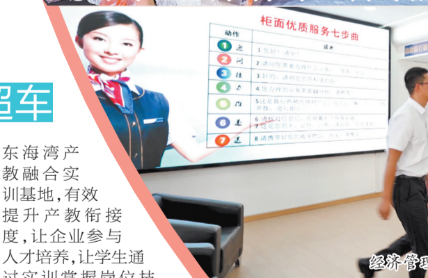
经济管理学院金融服务与管理专业群学生在学院模拟银行实训