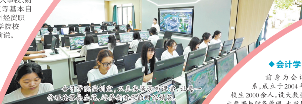
会计学院实训室,以真实场景为课堂,让每一份理论落地生根,培养新时代的财经精英。