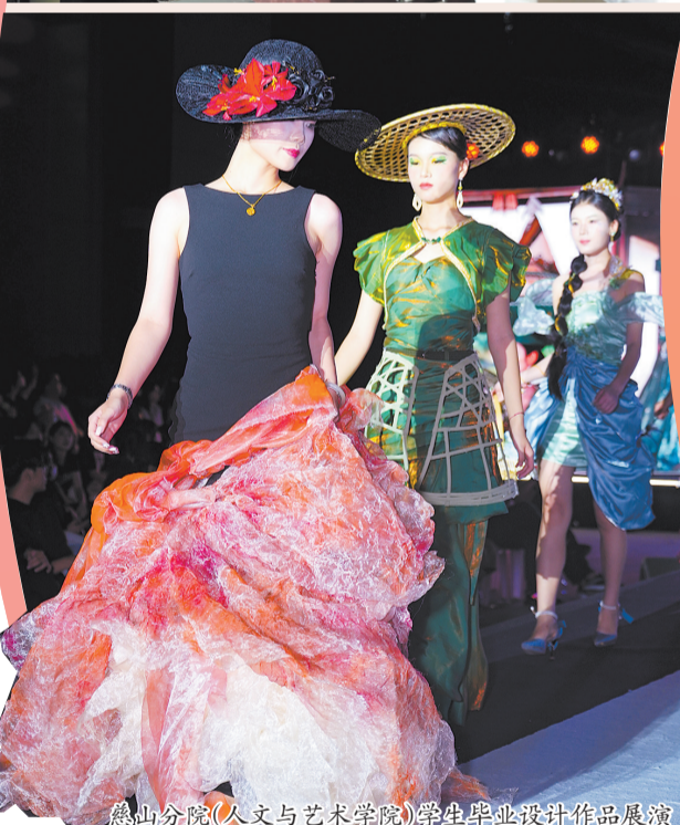
慈山分院(人文与艺术学院)学生毕业设计作品展演