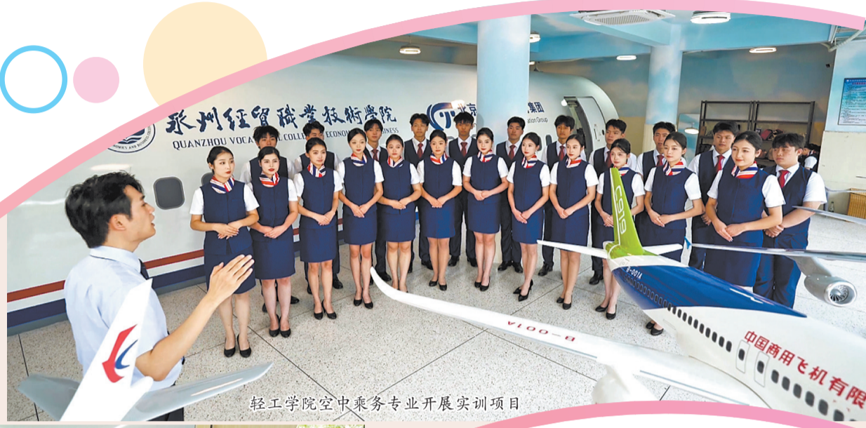
轻工学院空中乘务专业开展实训项目

通过产教深度融合、校企紧密合作,增强服务区域发展的适应性、匹配度和贡献率,以新质生产力有效提高人才自主培养质量,这就是泉州经贸职业技术学院对新时代产教融合职业教育体系的独特注解。