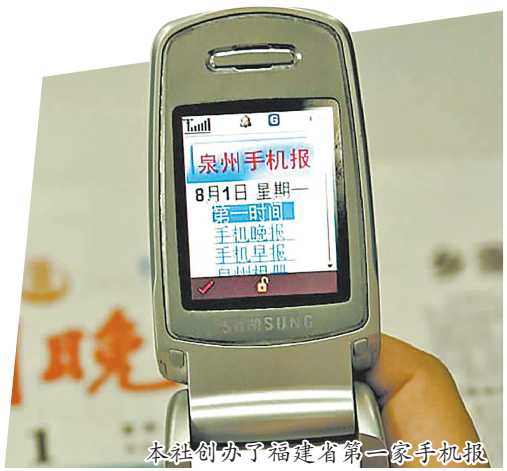
本社创办了福建省第一家手机报。