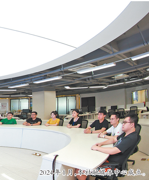
2024年1月,本社融媒体中心成立。

创新脚步不仅停留在文化传播，更延伸至服务社会发展的广阔领域。2017年8月，本社泉州网“创客联盟”手机网站正式上线，搭建起“线上+线下”的双创服务矩阵。凭借这种创新服务模式，“创客联盟”在2019年脱颖而出，成为福建省唯一入选全国“网信创新工作50例”的创新项目，为探索区域创新