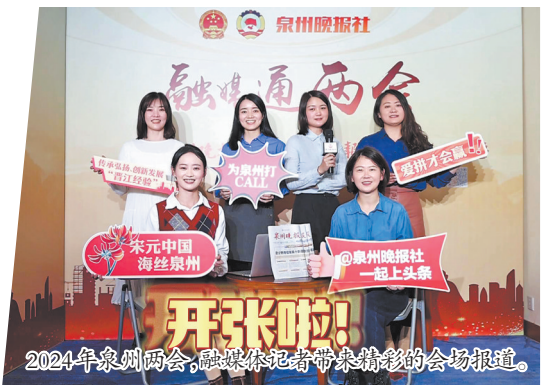
2024年泉州两会,融媒体记者带来精彩的会场报道。