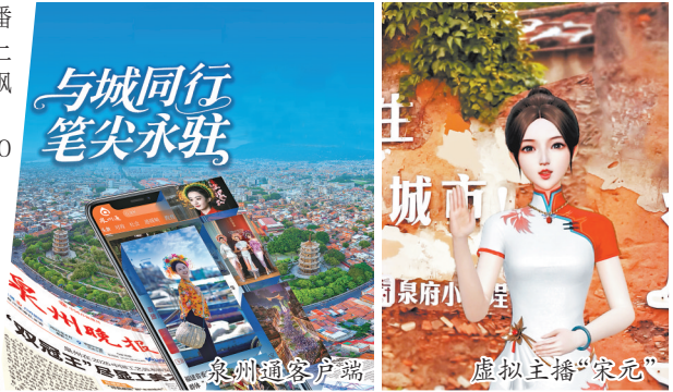
与城同行 笔尖永驻 泉州通客户端