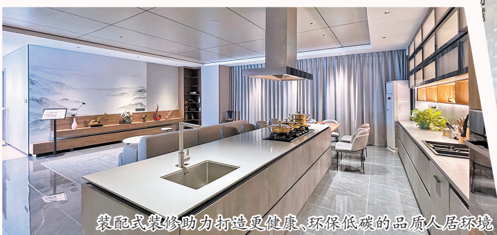
装配式装修助力打造更健康、环保低碳的品质人居环境