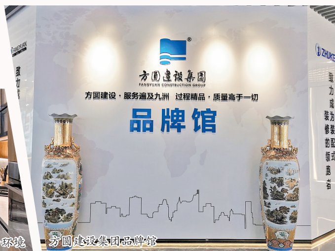
方圆建设集团品牌馆