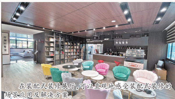
在装配式装修展厅，可以直观地感受装配式装修的场景应用及解决方案。