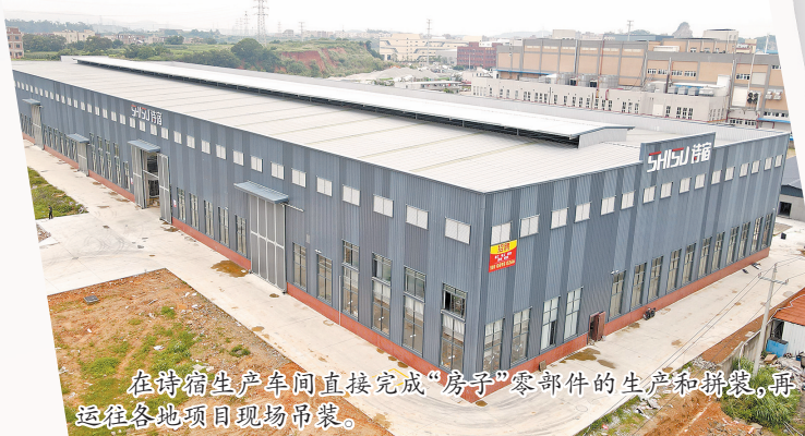
在诗宿生产车间直接完成“房子”零部件的生产和拼装，再运往各地项目现场吊装。

从汶川地震后捐款、防抗台风及灾后恢复重建，到助力闽宁对口扶贫、定向支持奖教奖学、参与爱心助学和关爱儿童行动，任剑锋不遗余力地在教育、医疗、弱势群体等领域出钱出力，连续多年获得“慈善事业贡献奖”荣誉称号，充分彰显富有责、富而有义、富而有爱的企业家情怀。